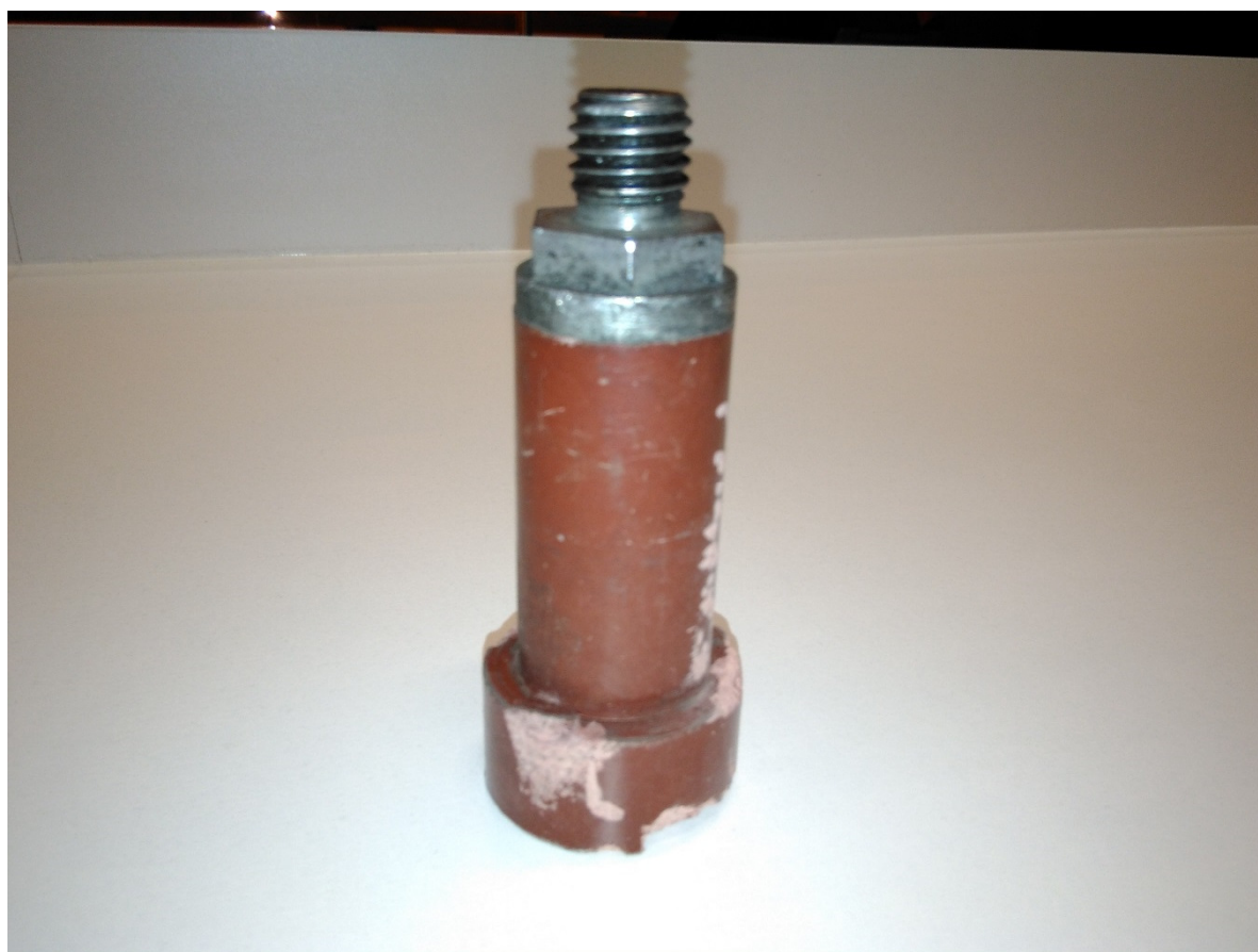
Imágenes de la muestra analizada