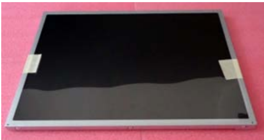
Pantalla con retroiluminación LED modelo G150XG01 V3