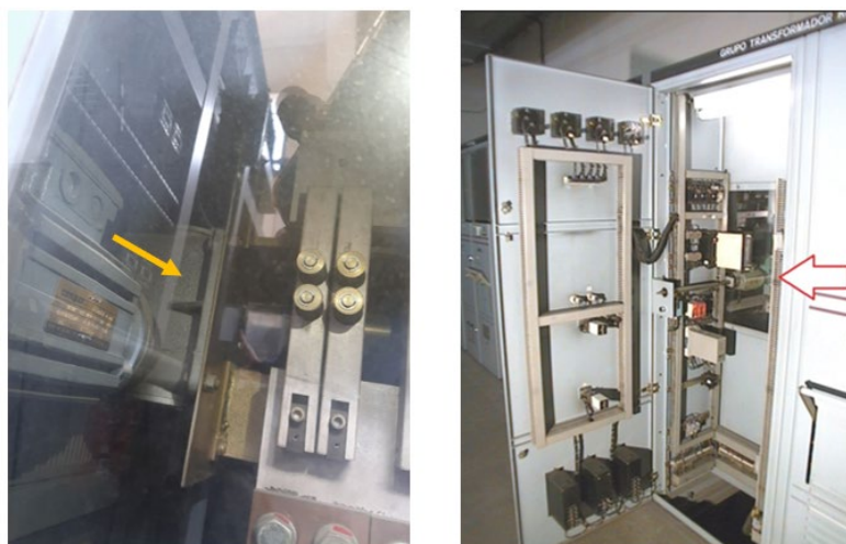
Seccionador motorizado de grupo rectificador.