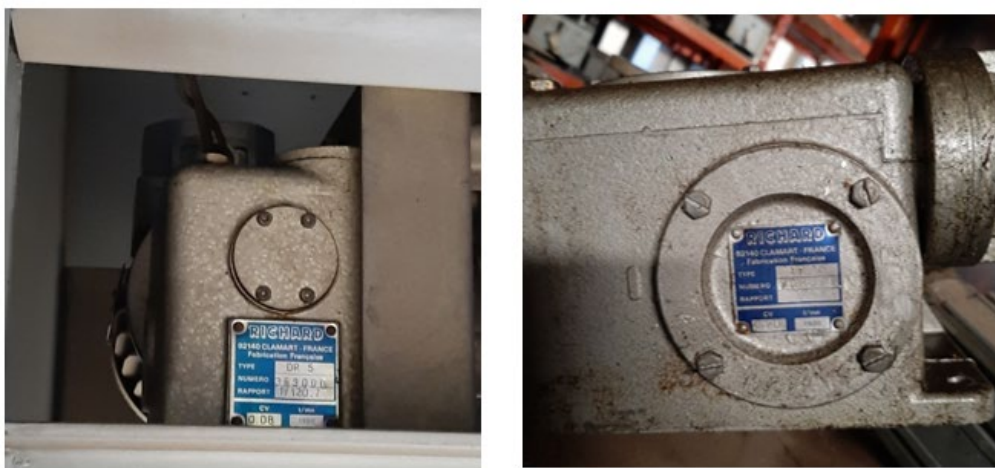
Cajas de desmultiplicación.