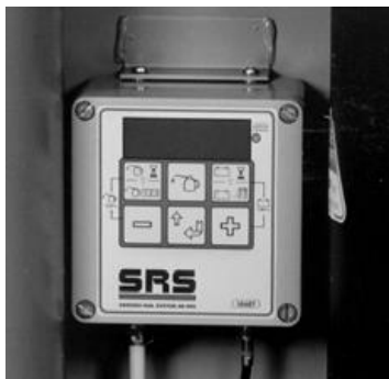
Vista frontal de la Unidad Electrónica de Control

La Unidad Electrónica de Control se programa asignando diferentes valores a los parámetros que tiene.