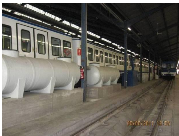
CANILLEJAS: Túnel de lavado CRHIST y recicladora