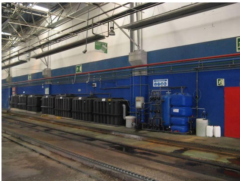
RECICLADORA AGUACLEAN: instaladas en los túneles de lavado de Laguna