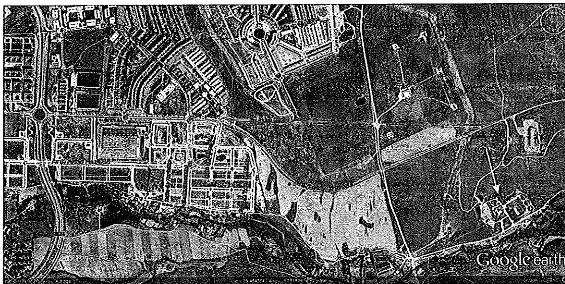
Imagen 1: Situación EDAR El Marco. Carretera Torrejón el Rubio. Cruce Polígono Ganadero

El punto de carga donde se realiza la carga directa de los lodos está situado en el interior de la instalación en el punto señalado a continuación: