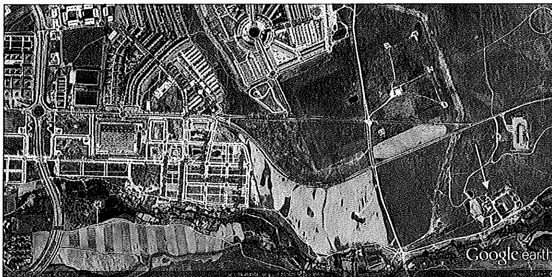
Imagen 1: Situación EDAR El Marco. Carretera Torrejón el Rubio. Cruce Polígono Ganadero