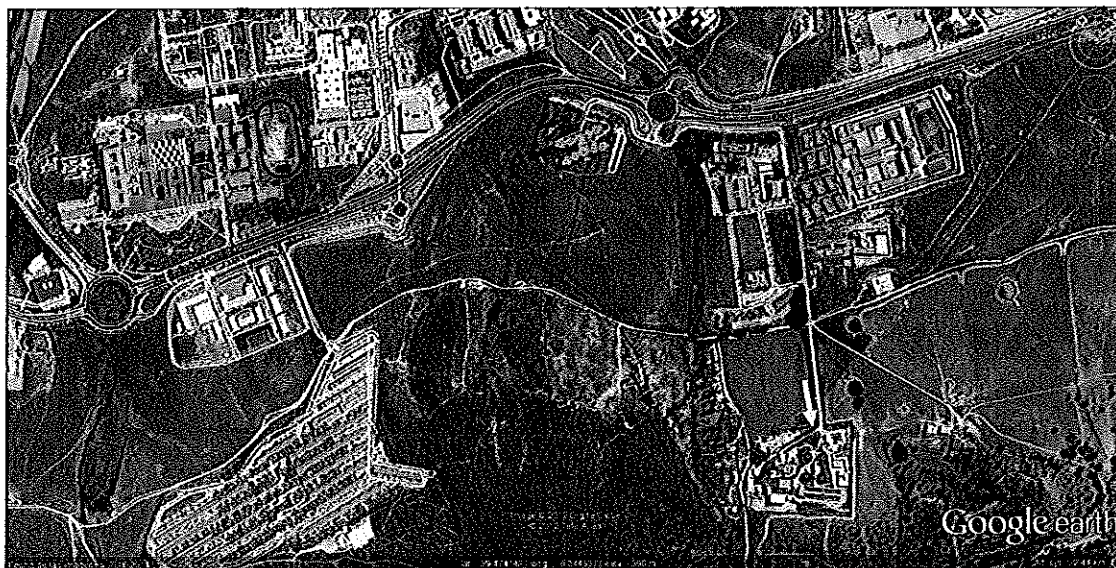
Imagen 1: Situación ETAP acceso por glorieta junto Residencia Asistida y Centro Penitenciario

El laboratorio de agua potable está situado en la Estación de Tratamiento de Agua Potable (ETAP) del término municipal de Cáceres ubicada en C/ Arroyo Valhondo, nº 7. Las coordenadas UTM son: X: 728715; Y: 4372241.