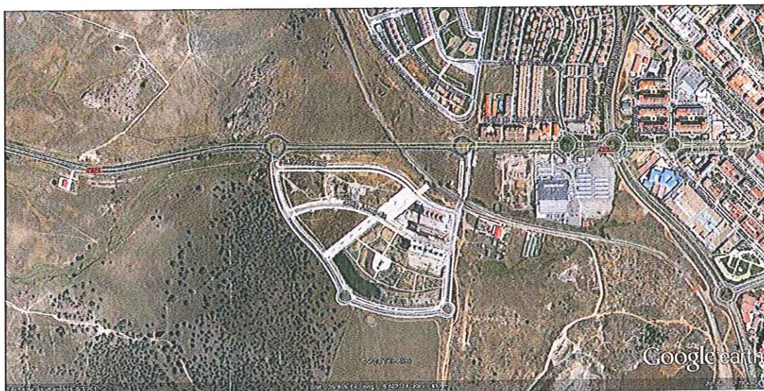
Imagen 3: Situación EDAR Malpartida.

Existen dos puntos de descarga, ubicados en la zona lateral de la instalación, siendo ambas de fácil accesibilidad. La capacidad de almacenamiento de los depósitos existentes es de 3 m 3 en cada una de las líneas.