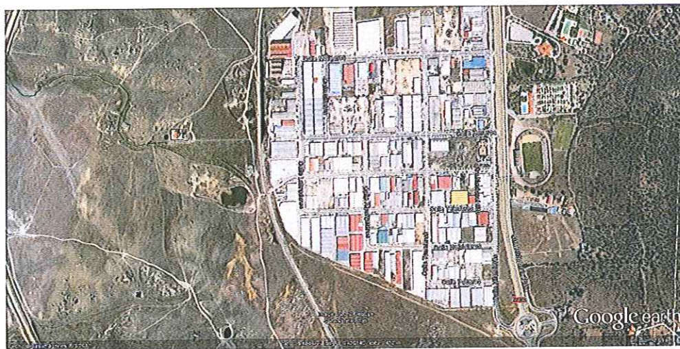
Imagen 1: Situación EDAR Capellanías.

Existen dos puntos de descarga, ubicados en la zona lateral de la instalación, siendo ambas de fácil accesibilidad. La capacidad de almacenamiento de los depósitos existentes es de 3 m 3 en cada una de las líneas.