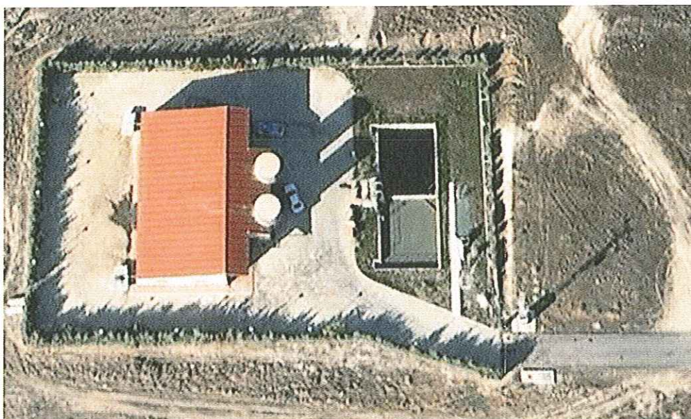
Imagen 2: Situación de los puntos de descarga.

Se trata de una instalación con dedicación parcial de un turno de trabajo diario según las necesidades de explotación, por lo que el horario para realizar la descarga se indicará por parte de Canal de Isabel II Gestión S.A. el día anterior a la descarga, completándose el servicio dentro del turno de trabajo de 8:00 h a 14:00 h.