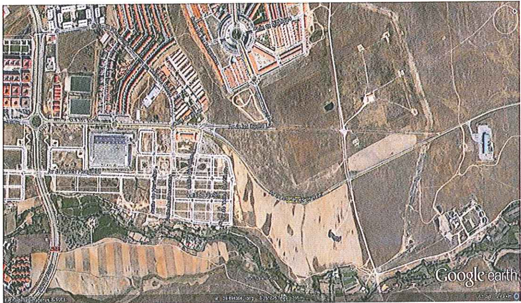
Imagen 5: Situación EDAR El Marco. Carretera Torrejón el Rubio. Cruce Polígono Ganadero

La EDAR “El Marco” del término municipal de Cáceres está ubicada en Ctra. De Torrejón El Rubio, Km. 2. Las coordenadas UTM son: X: 728715; Y: 4375628.