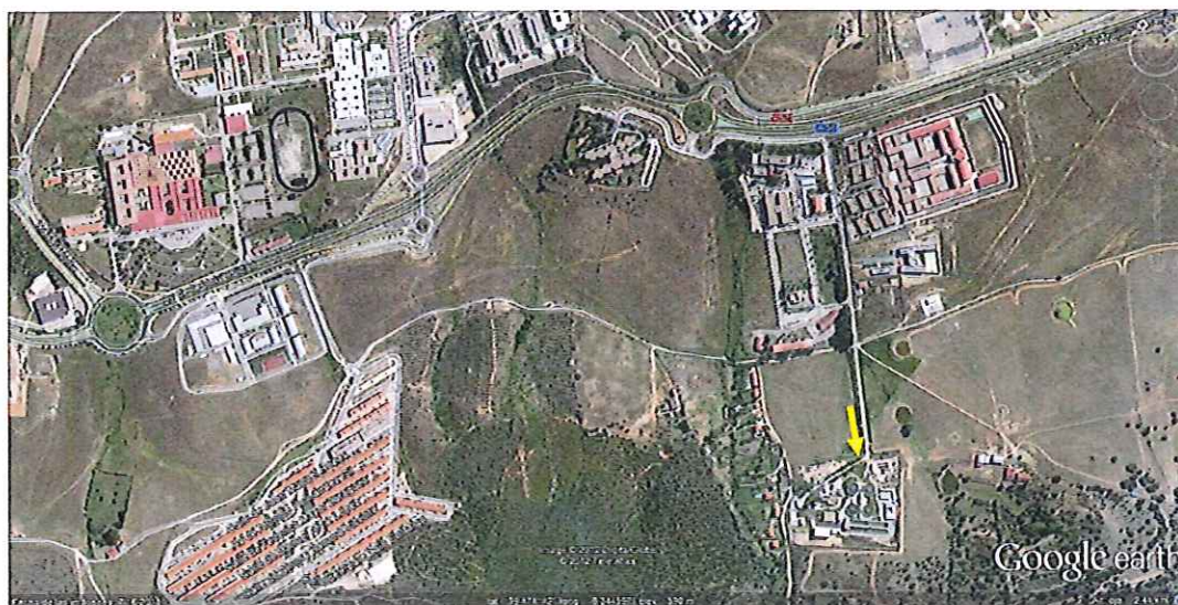
Imagen 1: Situación ETAP acceso por glorieta junto Residencia Asistida y Centro Penitenciario

El punto de entrega del producto objeto de este contrato se realizará en la Estación de Tratamiento de Agua potable del término municipal de Cáceres ubicada en C/ Arroyo Valhondo, nº 7.