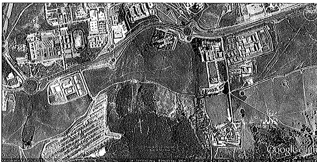
Imagen 1: Situación ETAP acceso por glorieta junto Residencia Asistida y Centro Penitenciario

El punto de entrega del producto objeto de este contrato se realizará en la Estación de Tratamiento de Agua potable del término municipal de Cáceres ubicada en C/ Arroyo Valhondo, nº 7.