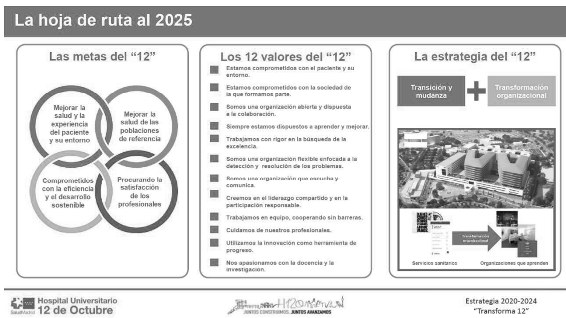
Figura 1. Estrategia 2020-2024. “Transforma 12”. Hoja de ruta al 2025.

En este nuevo ciclo estratégico se han establecido la hoja de ruta al 2025 (Figura 1), que comprende las metas y los valores del H12O, así como la orientación conceptual del proceso de transformación.