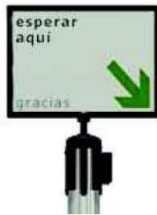
Ilustración 6: Imagen