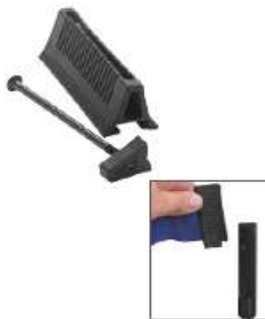
Ilustración 9: Imagen