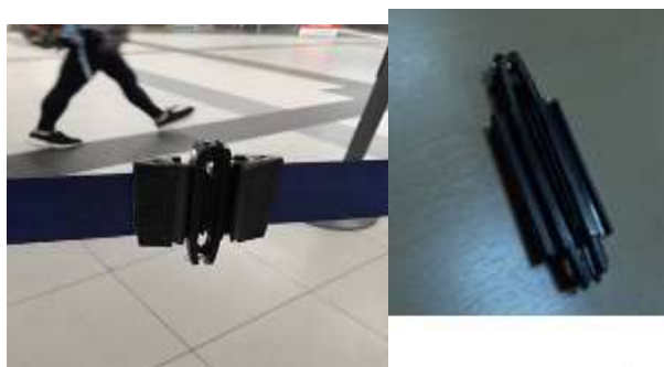
Ilustración 10: Imagen