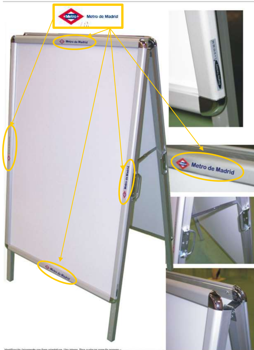
Ilustración 1: Imagen