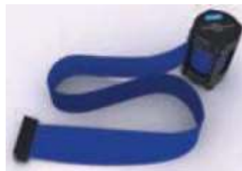
Ilustración 7: Imagen