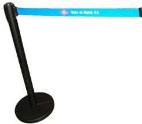
Ilustración 2: Imagen