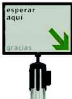
Ilustración 5: Imagen