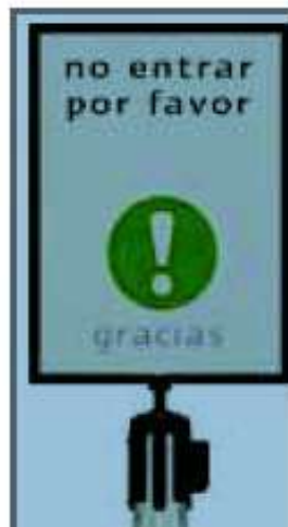
Ilustración 4: Imagen