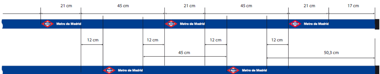
Ilustración 3: Serigrafía

NOTA: El adjudicatario enviará el arte final que deberá ser validado por Metro previo a la puesta en marcha de la orden de entrega.