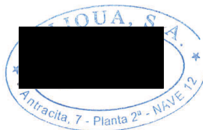
Fdo.: Jesús Pérez Ciruelos