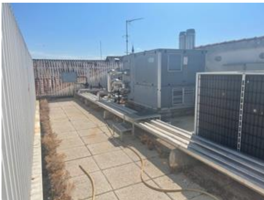
Azotea de instalaciones en el edificio de Administración.