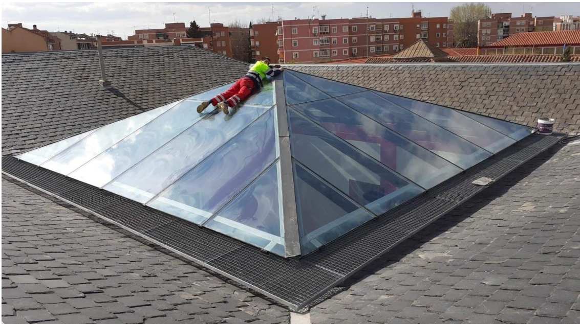
Estado actual de las cubiertas con el lucernario y estructura de las cubiertas

En el estado actual, la cubierta del edificio de Docencia y UTRH-1 es inclinada en crujías a dos aguas alrededor de un lucernario central. La estructura de la cubierta es de vigueta pretensada apoyada en muros de carga y tablero de ladrillo sobre tabiques palomeros. El acabado es de pizarra.