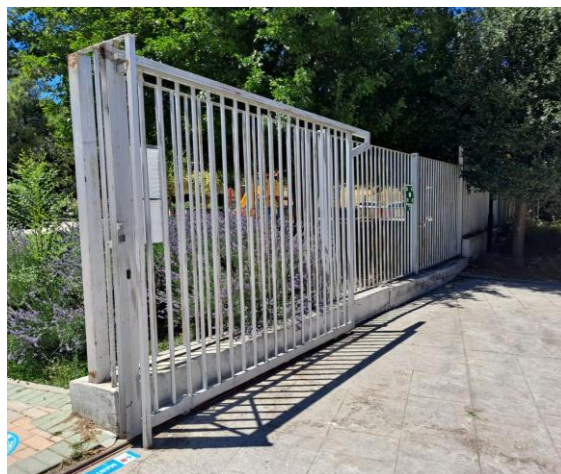
Vallado entre el Hospital de Día y Administración y el edificio de talleres (no perteneciente al HUIJG)