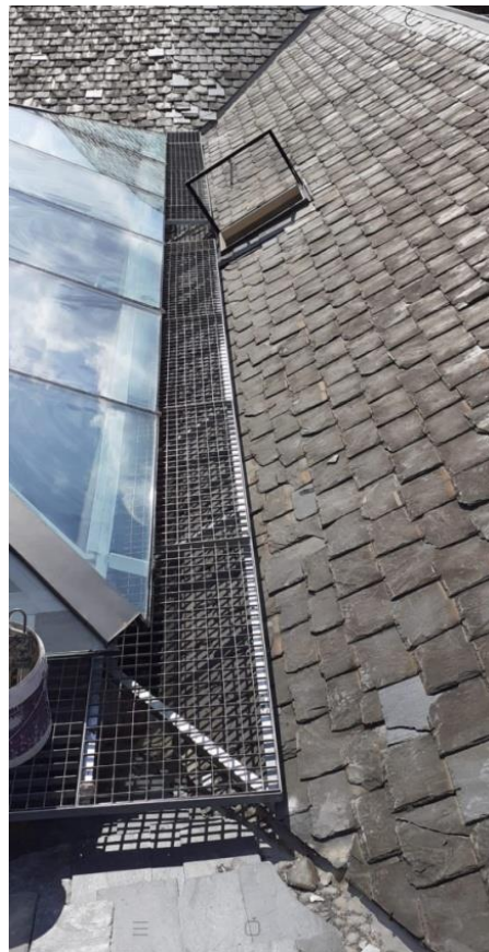
Estado actual del acceso a la cubierta, vista desde el interior y en el exterior.

La actuación consiste en ejecutar una azotea de instalaciones con una superficie aproximada de 60m 2 en la esquina sur del edificio, afectando al faldón de cubierta con pendiente hacia el patio de la UTHR-1.