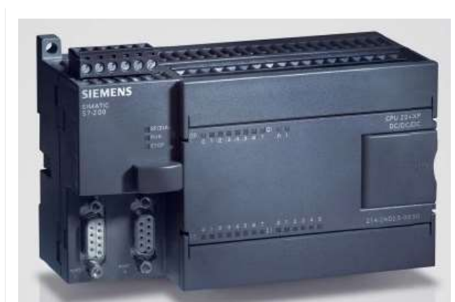
Imagen 1 – Autómata de Cancela S7-200, CPU 224

Dada la importancia de estos equipos para el continuo funcionamiento de las instalaciones, se hace necesario un contrato de mantenimiento de los mismos por técnicos especialistas y cualificados, ya que su coste unitario es elevado y es económicamente más eficiente efectuar su reparación.