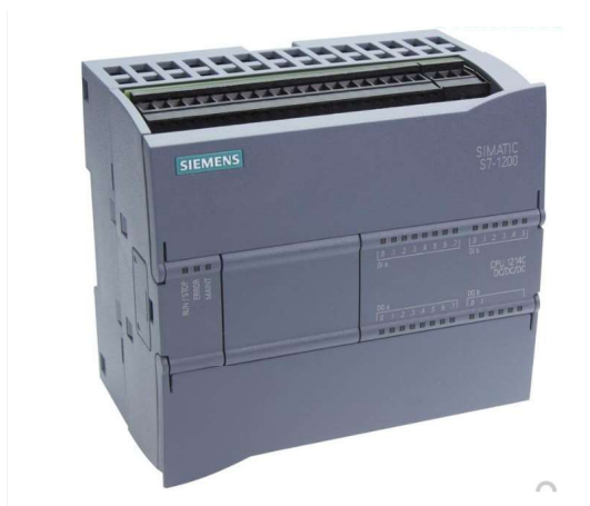
Imagen 2 - Autómata de Cancela S7-1200