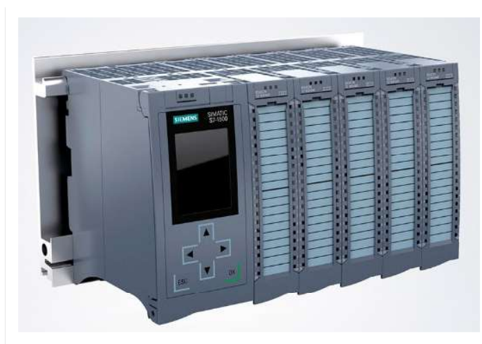
Imagen 3 - Autómata de CGBT y ventilación S7-1500

El alcance de la presente solicitud de contratación se extiende a cualquier PLC de la marca Siemens mantenido por la sección de instalaciones de baja tensión (IBT). Los trabajos considerados tienen la siguiente clasificación: