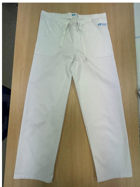
Imagen tipo del artículo: