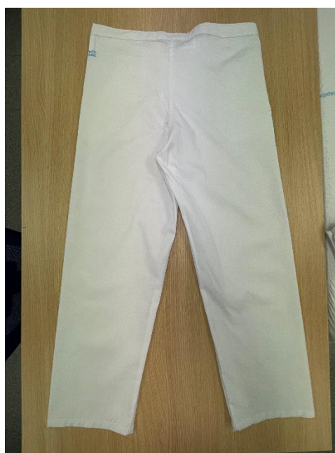
Imagen tipo de las serigrafías: