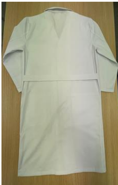
Imagen tipo de las serigrafías: