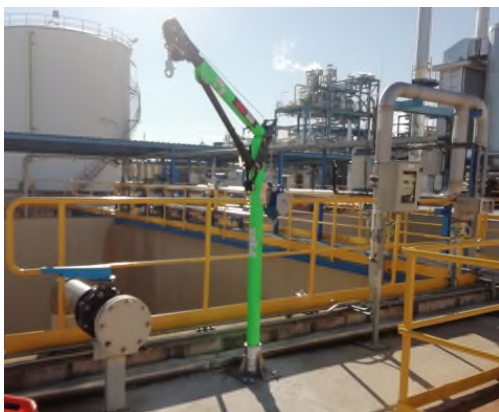
Imagen mástil con brazo pescante insertada en base sobre superficie horizontal