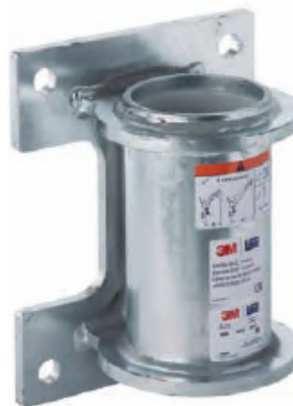
Anclaje para superficie vertical