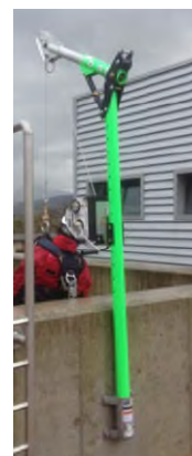
Imagen pescante insertada en base sobre superficie vertical