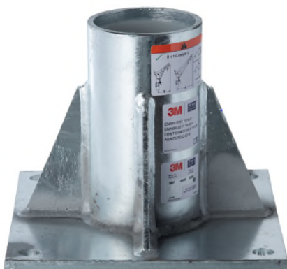
Anclaje para superficie horizontal