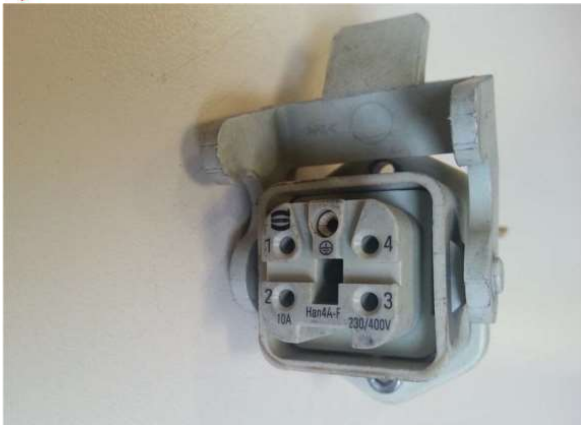
CONECTOR HARTING: 1º ROJO 2º NEGRO 3º NEGRO 4º AMARILLO