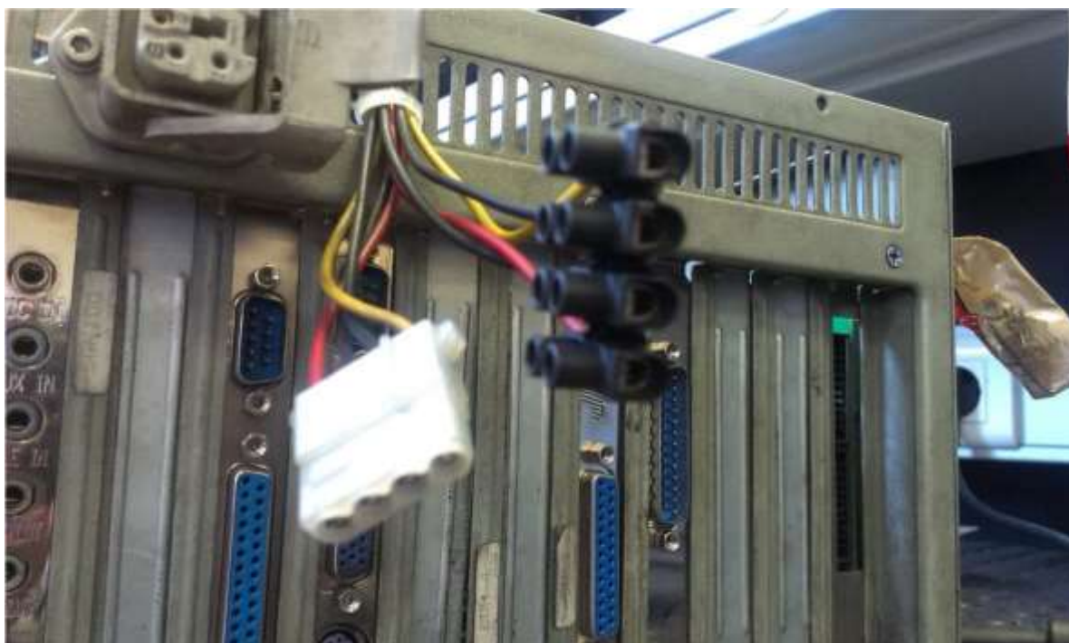
CLEMA: 1º ROJO 2º NEGRO 3º NEGRO 4º AMARILLO