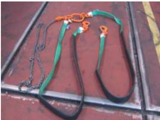
ELEMENTO N.º 6