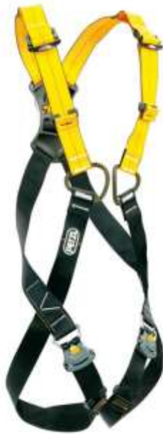
ARNES NEWTON MARCA PETZL con la inclusión de 3 mosquetones de seguridad de cierre roscado. Talla XL