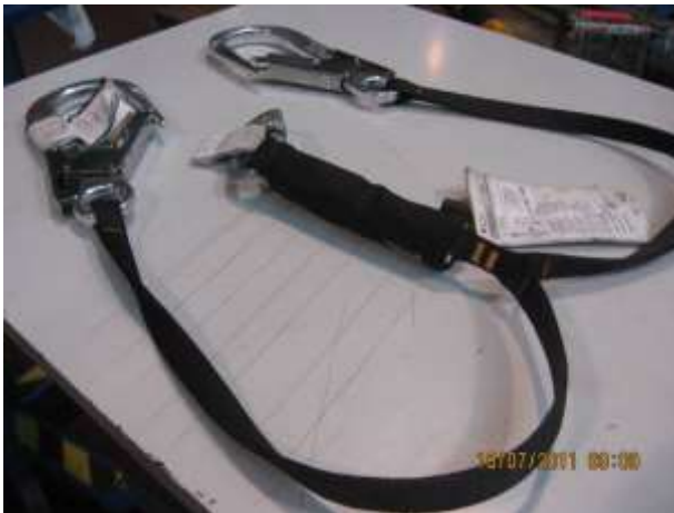
ABSORBEDOR DE ENERGÍA ABSÓRBICA DE DOBLE ANCLAJE EN Y , con la inclusión de 2 PINZAS DE ANCLAJE MGO 80 de la MARCA PETZL