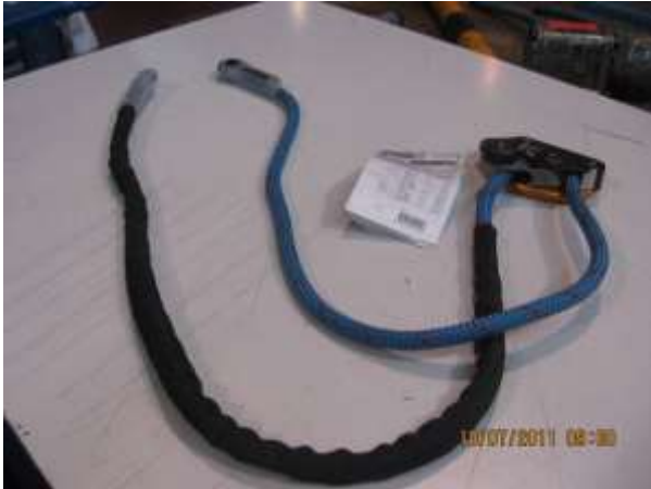
GRILLÓN de 2 metros con elementos de sujeción MARCA PETZL