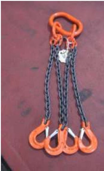
ELEMENTO N.º 5