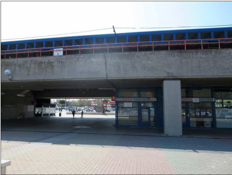
Fachada (acceso C/ Maqueda y C/ Ocaña)