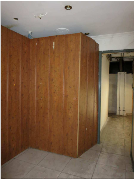
Interior planta superior