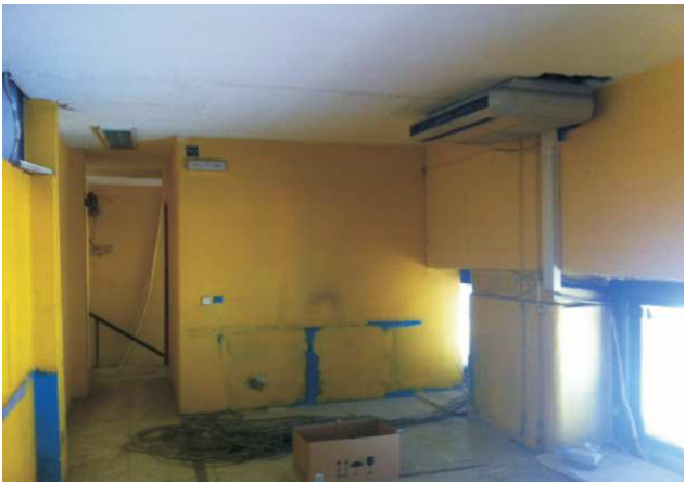
Interior planta superior