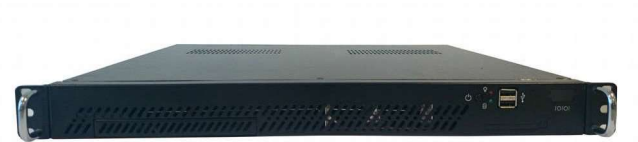
Figura 1. Formato Constructivo del Pupitre de Control de Peaje en formato 1U Rack 19".

Los Pupitres de Control de Peaje están dotados de un hardware específico con Sistema Operativo Linux, 256 MB de memoria RAM y disco duro de tecnología magnética. El software de estos equipos permite la integración de las canceladoras, los Torniquetes y portones de paso de la red.