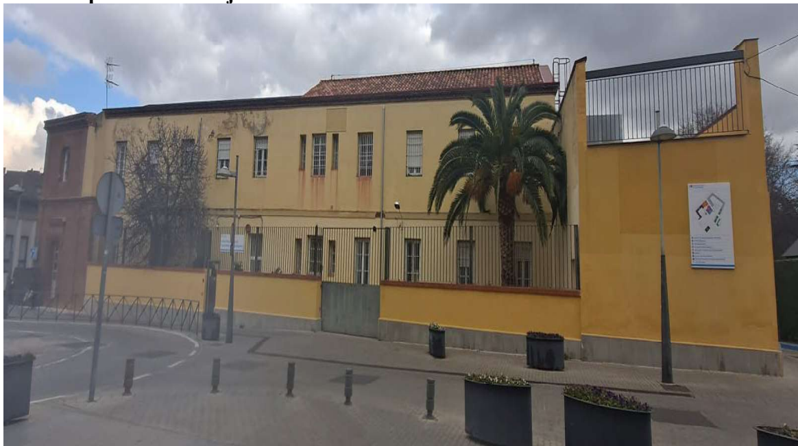
Estado actual de la zona de actuación.