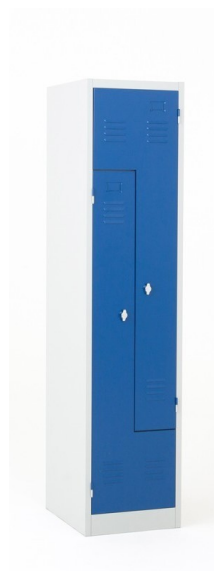
Vista Delantera - Cerrada