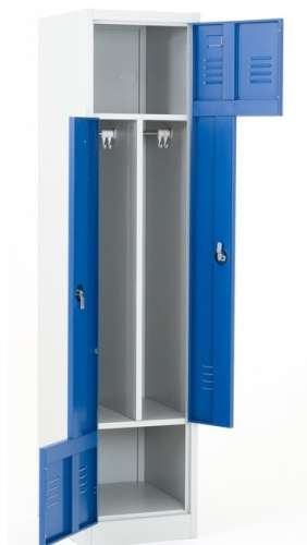
Vista Delantera - Abierta