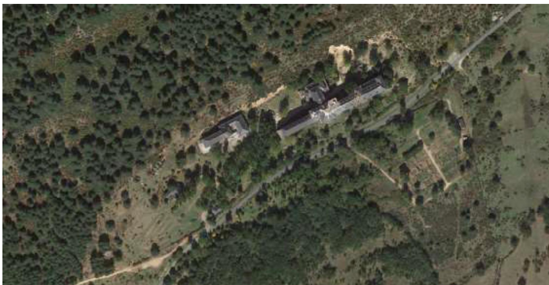
Fig.2– Vista aérea de la Finca