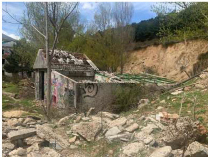
Imagen de las casetas de instalaciones del depósito desde el este

Se trata de dos pequeñas casetas destinadas a pocilga y gallinero, con una superficie de solera de 140 metros cuadrados y una superficie construida de 70 metros cuadrados. A nivel constructivo se trata de una caseta con muros de carga cerámicos sobre solera de hormigón y con una cubierta, ya demolida, de fibrocemento sobre perfilería metálica.