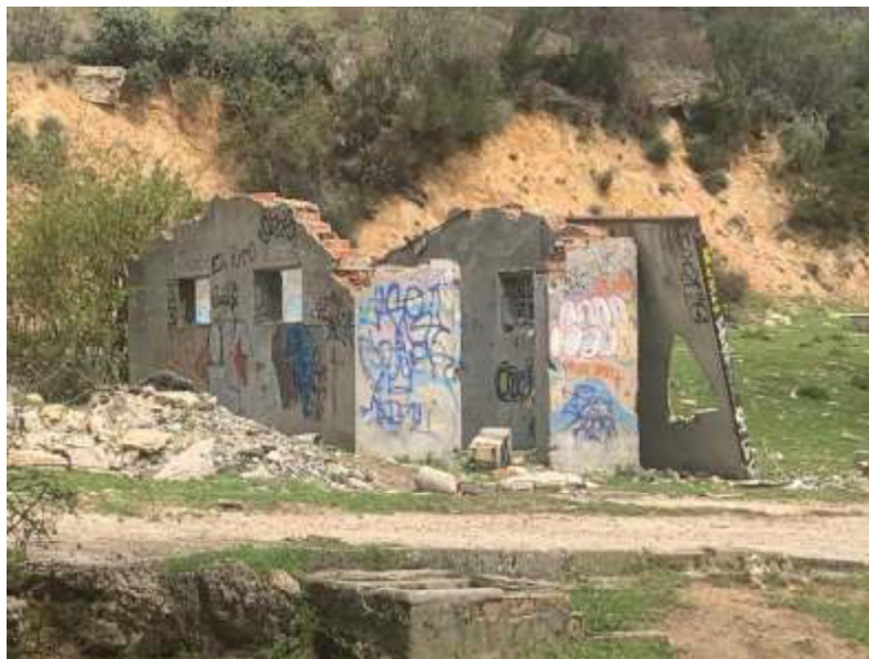
Imagen del cuarto de basuras desde el sur.