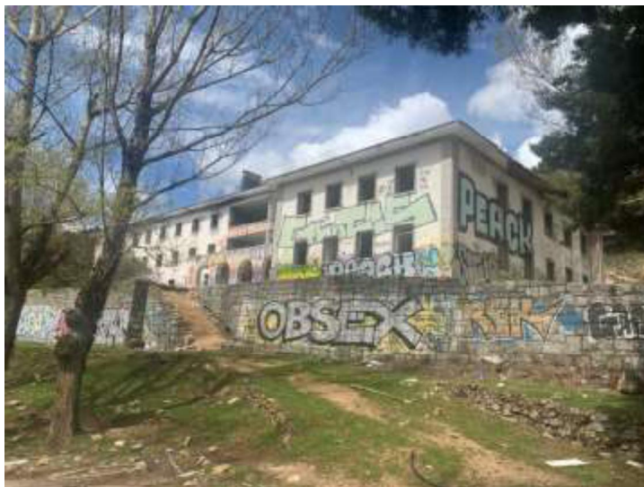
Fachadas sur y este del edificio

Se trata de un pequeño inmueble con tipología asimilable a una vivienda unifamiliar de tamaño medio o un pequeño edificio o club social. Tiene dos plantas sobre rasante, con generosas terrazas exteriores en planta baja. Tiene una superficie construida de 326 metros cuadrados construidos, distribuidos en dos plantas.