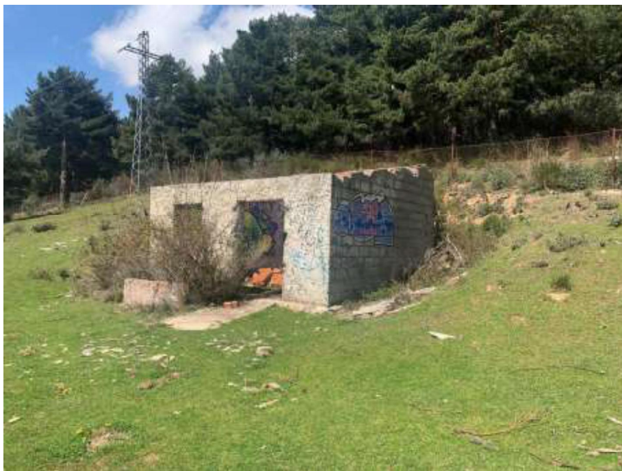
Edificio 7 visto desde el este

Es una pequeña construcción de una planta situada al oeste del complejo. Se desconoce el uso original de esta caseta, construida con muros de bloque de hormigón y cubierta de fibrocemento, ya demolida. Su superficie construida es de 28 metros cuadrados.