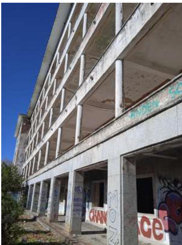
Fig. 4 – Aspecto exterior de la construcción principal (fachada principal)

En cuanto a su estado de conservación, tiene demolida gran parte de los elementos en tabiquería interior (salvo en la planta semisótano y zonas localizadas), en carpinterías interiores y exteriores (salvo zonas localizadas), en suelos (salvo en la planta semisótano, escaleras y zonas localizadas) y en instalaciones vistas y cableados.