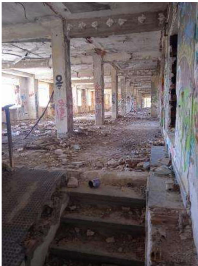
Fig. 5– Aspecto interior de la construcción principal