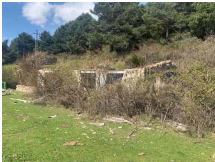
Imagen del edificio 6 desde el sur.

Se trata de dos pequeñas casetas destinadas a pocilga y gallinero, con una superficie de solera de 140 metros cuadrados y una superficie construida de 70 metros cuadrados. A nivel constructivo se trata de una caseta con muros de carga cerámicos sobre solera de hormigón y con una cubierta, ya demolida, de fibrocemento sobre perfilería metálica.