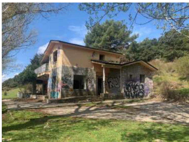
Edificio 3 desde el este

En cuanto a su estado de conservación tiene demolida parte de los elementos en carpinterías interiores y exteriores (salvo zonas puntuales y cercos), en instalaciones vistas y cableados, y en tabiquería y falsos techos.