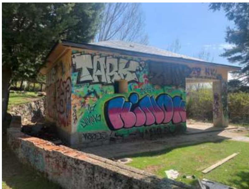
Fachada oeste del edificio 4

Tiene demolida parte de los elementos en carpinterías interiores y exteriores (salvo zonas puntuales y cercos), en instalaciones vistas y cableados, y en tabiquería y falsos techos.