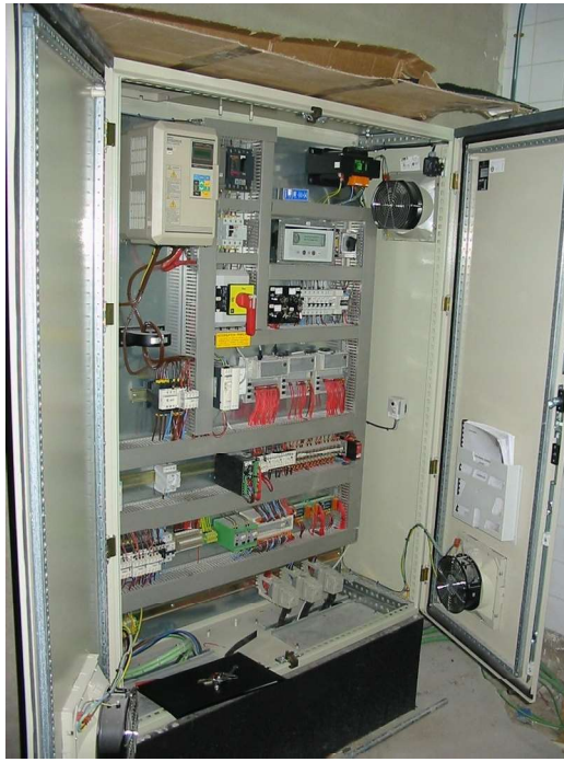
Foto2: Armario de maniobra escalera mecánica THYSSEN