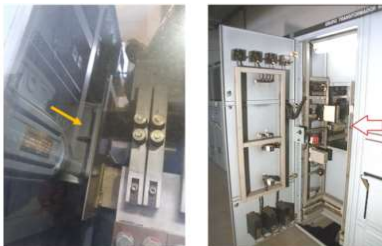
Seccionador motorizado de grupo rectificador.