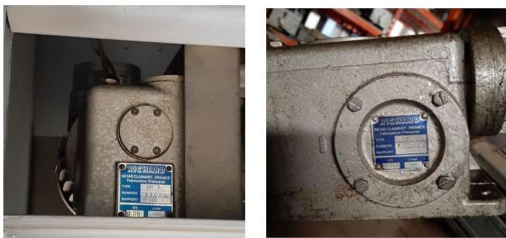
Cajas de desmultiplicación.