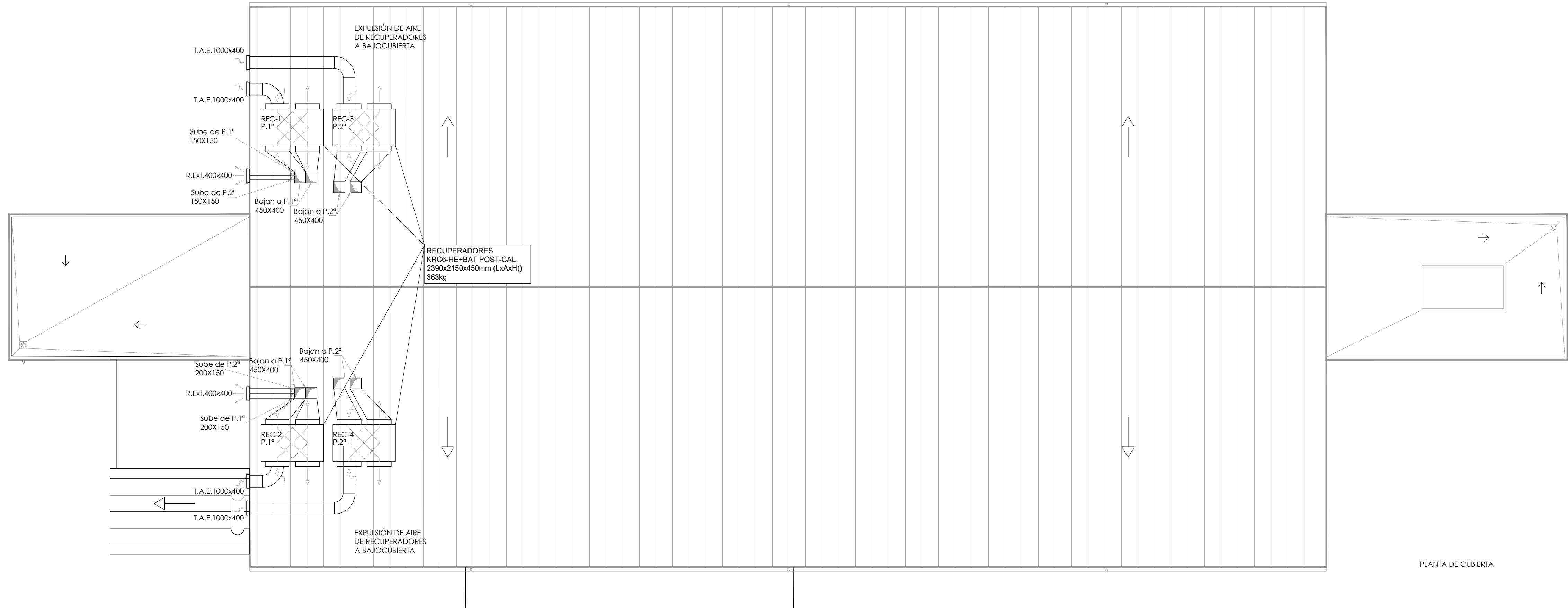
PLANTA DE CUBIERTA