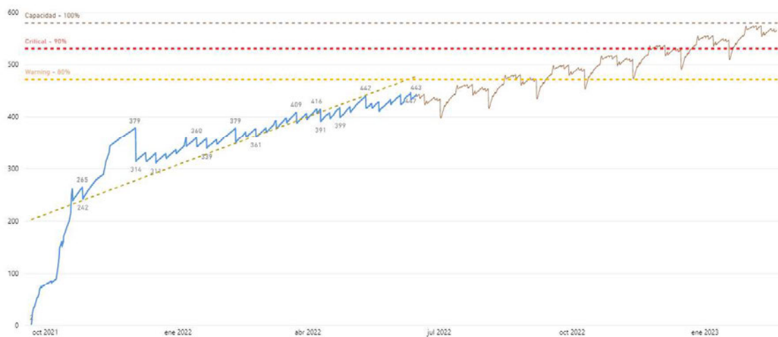
Gráfico 1 – Ocupación cabina de almacenamiento deduplicada CPD 1

En la siguiente imagen, puede apreciarse el estado de llenado en el momento de redacción de la presente Solicitud de Contratación, así como una predicción de ocupación siguiendo la serie histórica con intervalo de confianza del 99%.