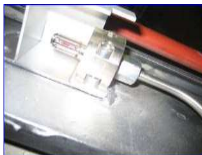
Figura 14 - Boquilla pilotaje térmico escalera mecánica