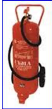
Figura 35 - Carro extintor polvo ABC 25 kg