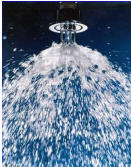
Figura 34 - Rociador