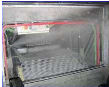
Figura 13 - Extinción en foso escalera mecánica