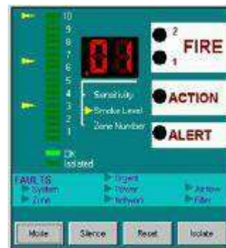
Figura 3 - Software equipo detección escaleras mecánicas

La alimentación eléctrica de cada detector es de 24 Vcc (18 – 30 Vcc), y proviene del sistema de alimentación ininterrumpida (SAI) situado en el armario de telegestión – telecontrol del cuarto de protección contra incendios (PCI). Además, cada detector dispone de su automático 1 A, y se ubica dentro de un armario para evitar cualquier daño mecánico sobre el mismo.