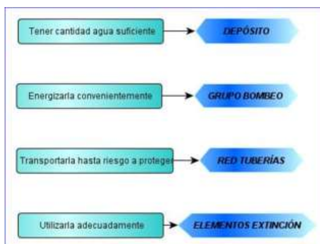
Figura 27 - Esquema de elementos de extinción

Como norma general en cualquier tipo de sistema de extinción de incendios basado en agua, es importantísimo tener en cuenta cuatro requisitos para el correcto funcionamiento del sistema: