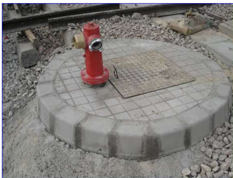
Figura 31 - Hidrante exterior de columna seca

Debido al riesgo eléctrico existente como consecuencia de las instalaciones de electrificación de la cochera y depósito, se instala un sistema de bocas de hidrantes, denominadas “hidrantes interiores”, que básicamente están formadas por una boca de salida de una tubería normal con racor para conexión de manguera de 45 mm.