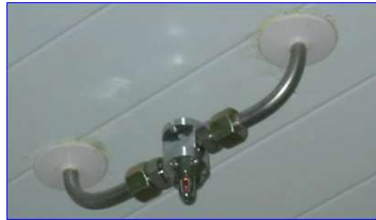
Figura 20 - Boquilla mixta