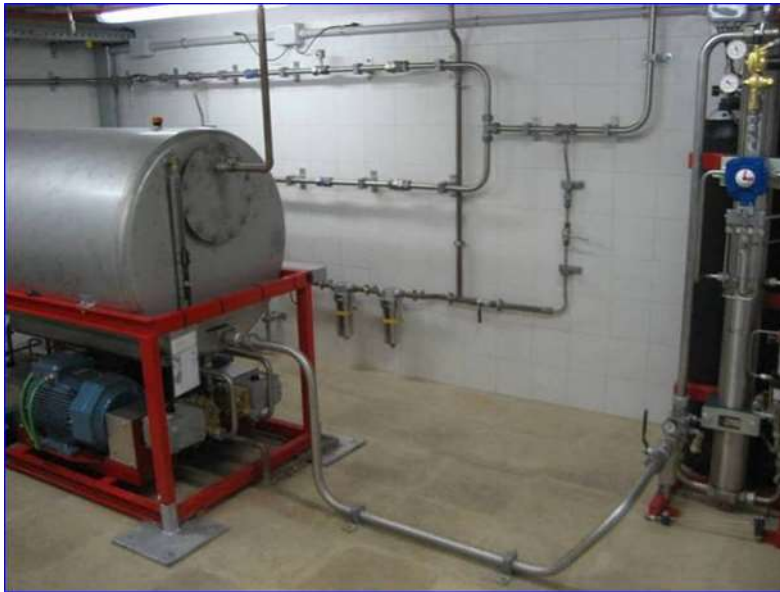
Figura 10 - Cuarto PCI extinción. Cuba almacenaje de agua

Los paneles de mando son los equipos que se utilizan para el manejo y la actuación sobre el sistema de extinción de agua nebulizada. Existen dos paneles de mando en la estación, uno de ellos en el cuarto de P.C.I., que recibe el nombre de panel maestro, y el otro se ubicará en el cuarto donde esté el personal de la estación, que recibirá el nombre de panel servidor; la elección de esta estructura viene dada porque el cuarto de P.C.I. normalmente en una estación subterránea está cerca de los cuartos técnicos, habitualmente a nivel de andén, mientras que el cuarto donde está el personal responsable de la atención al público en la estación, suele estar en un acceso a la misma. En el mismo armario del panel maestro se encuentra el cuadro eléctrico que gobierna el equipo de bombeo eléctrico y de emergencia.