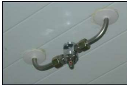
Figura 9 - Boquilla mixta

En los mencionados casos el equipo suministra el agua necesaria para sofocar el incendio y posterior refrigeración del espacio afectado, durante un tiempo garantizado de 10 minutos por el agua almacenada en el depósito, más el tiempo de descarga del agua aportada por la red de la estación. El sistema está concebido para que, en caso de la apertura de una o varios sprinklers, se produzca la despresurización de la red, provocando el arranque de las bombas.