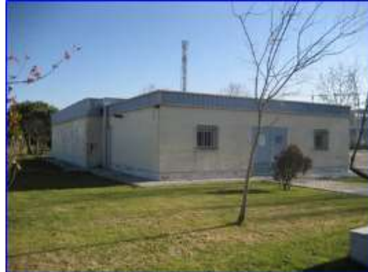
Figura 29 - Aljibe terminado

El grupo de presión está formado por los siguientes elementos: