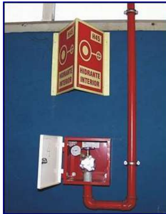
Figura 32 - Hidrante interior

Otros elementos de extinción manual son las Bocas de Incendio Equipadas (BIEs), instaladas en almacenes y vestuarios, alejadas al menos 25 de metros de las zonas donde haya cable de tracción. Básicamente están formadas por una chapa de acero pintada en rojo, marco en acero cromado con cerradura de cuadradillo de 8 mm, rótulo rómpase en caso de incendio, devanadera con toma axial abatible, válvula de 1" con 20 m de manguera semirrígida y manómetro de 0 a 16 kg/cm 2 .