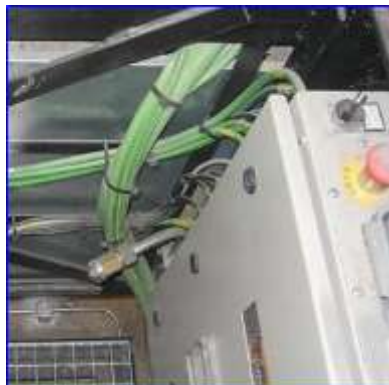
Figura 7 - Boquilla abierta foso escalera mecánica