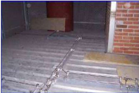
Figura 19 - Tuberías acero inoxidable y soportaciones