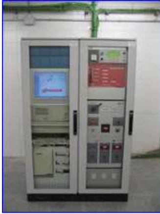
Figura 5 - Cuadros control extinción y equipos integración