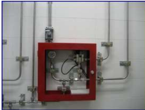
Figura 23 - válvula NS12 extinción cuarto técnico

Cualquier proceso de extinción provoca señales de alarma que se recogen en los paneles de control del sistema para su posterior transmisión a C.C.I. y Puesto Central de Control (PCC).