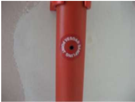
Figura 2– Orificio de aspiración