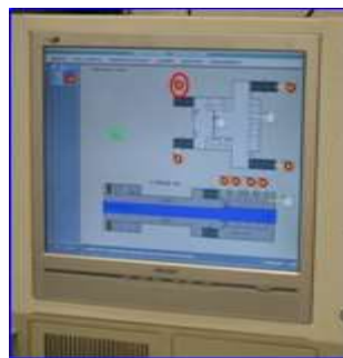
Figura 17 - Concentrador estación

El sistema de extinción también se extiende a los cuartos técnicos, entendiéndose como tales los cuartos de baja tensión, alta tensión, comunicaciones y enclavamiento. Para ello se ha aprovechado el grupo de emergencia neumático existente, utilizándolo como grupo principal de extinción en este tipo de cuartos, actuando de agente impulsor el nitrógeno seco existente en los cilindros de 50 l y 200 bar que forman parte de este equipo. Cuando se produce el disparo de extinción en este tipo de riesgos, se activa el “by-pass” de dicho grupo, que aumenta la cantidad de nitrógeno en la mezcla nitrógeno + agua, disminuyendo la cantidad de agua que se proyecta en la nebulización.