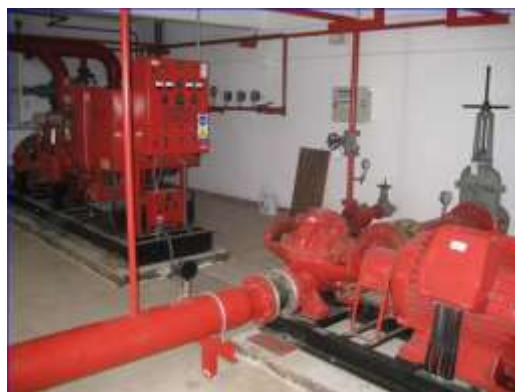
Figura 30 - Grupo eléctrico y grupo diésel principales