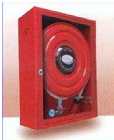
Figura 33 - Boca de incendio equipada 25 mm diámetro

Otros elementos de extinción manual son las Bocas de Incendio Equipadas (BIEs), instaladas en almacenes y vestuarios, alejadas al menos 25 de metros de las zonas donde haya cable de tracción. Básicamente están formadas por una chapa de acero pintada en rojo, marco en acero cromado con cerradura de cuadradillo de 8 mm, rótulo rómpase en caso de incendio, devanadera con toma axial abatible, válvula de 1" con 20 m de manguera semirrígida y manómetro de 0 a 16 kg/cm 2 .