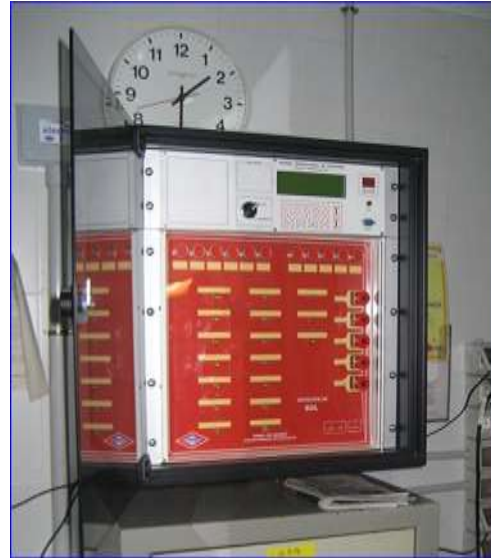
Figura 12 - Panel servidor extinción

En estos paneles maestro y servidor aparecen fundamentalmente 3 tipos de elementos: