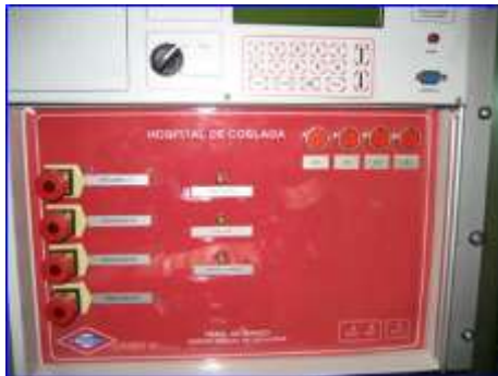
Figura 21 - Panel maestro extinción