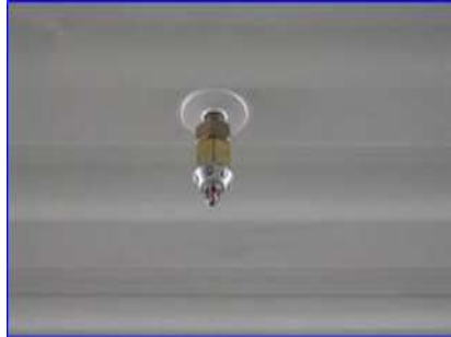
Figura 8 - Boquilla cerrada cuarto no técnico