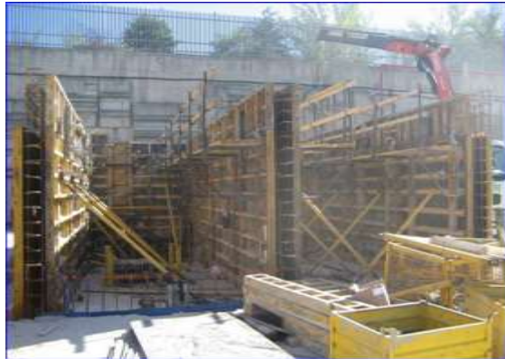
Figura 28 - Aljibe en construcción

El aljibe se sitúa preferiblemente en superficie y tiene una capacidad para cubrir el 100% de la demanda de los diferentes sistemas con la simultaneidad correspondiente a lo indicado en las normativas vigentes. Está construido en hormigón, formado por dos semi-depósitos unidos entre sí, tanto en su arquitectura como hidráulicamente, con llaves de seccionamiento individuales, dispuestas aguas arriba del punto común de entrada de agua al circuito de aspiración del grupo de bombeo.