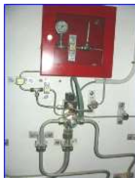
Figura 15 - Válvula extinción NS20 escalera mecánica