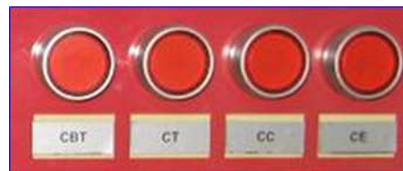
Figura 22 - Pulsadores extinción cuartos técnicos