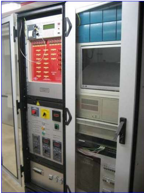
Figura 11 - Panel maestro extinción y cuadro eléctrico bombas