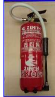
Figura 36 - Extintor polvo ABC 6 kg