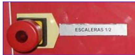
Figura 16 - Seta extinción escaleras mecánicas