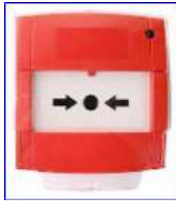
Figura 25 - Pulsador de alarma