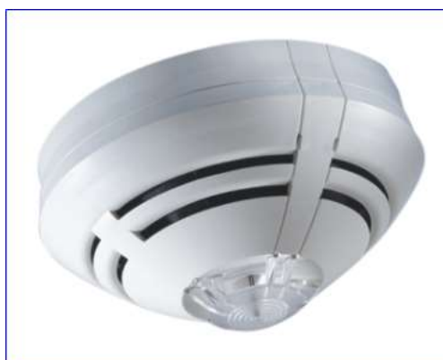
Figura 24 - Detector puntual de incendios