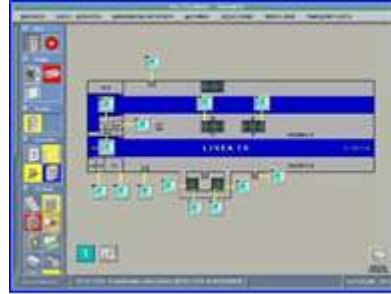
Figura 6 - Visualización elementos detección en estación