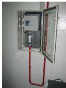
Figura 4– Detector Vesda láser compact

La alimentación eléctrica de cada detector es de 24 Vcc (18 – 30 Vcc), y proviene del sistema de alimentación ininterrumpida (SAI) situado en el armario de telegestión – telecontrol del cuarto de protección contra incendios (PCI). Además, cada detector dispone de su automático 1 A, y se ubica dentro de un armario para evitar cualquier daño mecánico sobre el mismo.