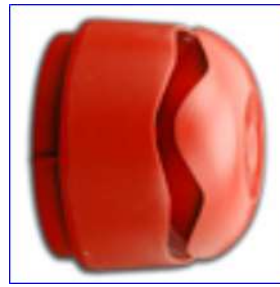
Figura 26 - Sirena de alarma

Las zonas objeto de instalación de pulsadores y sirenas pueden dividirse en dos grandes grupos: