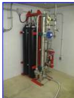
Figura 18 - Grupo botellas

El sistema de extinción también se extiende a los cuartos técnicos, entendiéndose como tales los cuartos de baja tensión, alta tensión, comunicaciones y enclavamiento. Para ello se ha aprovechado el grupo de emergencia neumático existente, utilizándolo como grupo principal de extinción en este tipo de cuartos, actuando de agente impulsor el nitrógeno seco existente en los cilindros de 50 l y 200 bar que forman parte de este equipo. Cuando se produce el disparo de extinción en este tipo de riesgos, se activa el “by-pass” de dicho grupo, que aumenta la cantidad de nitrógeno en la mezcla nitrógeno + agua, disminuyendo la cantidad de agua que se proyecta en la nebulización.