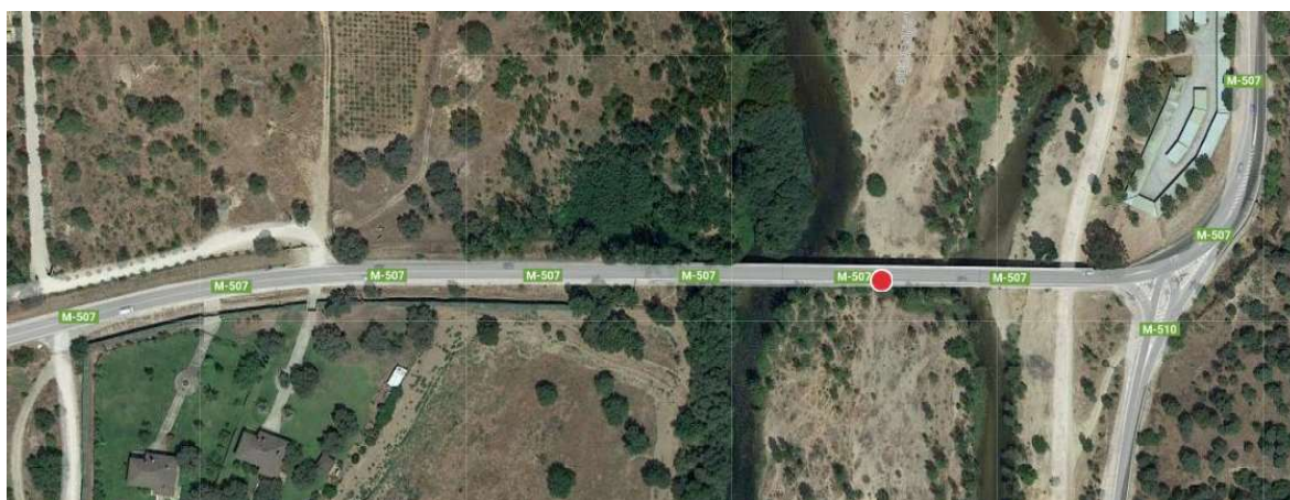
Figura n.º 1. Ortofoto del puente y sus accesos

rasante del tablero hasta la cota actual). Esto obliga a modificar la rasante y el propio trazado de los accesos de ambas carreteras a la intersección en unas distancias de aproximadamente 50 a 100 m.