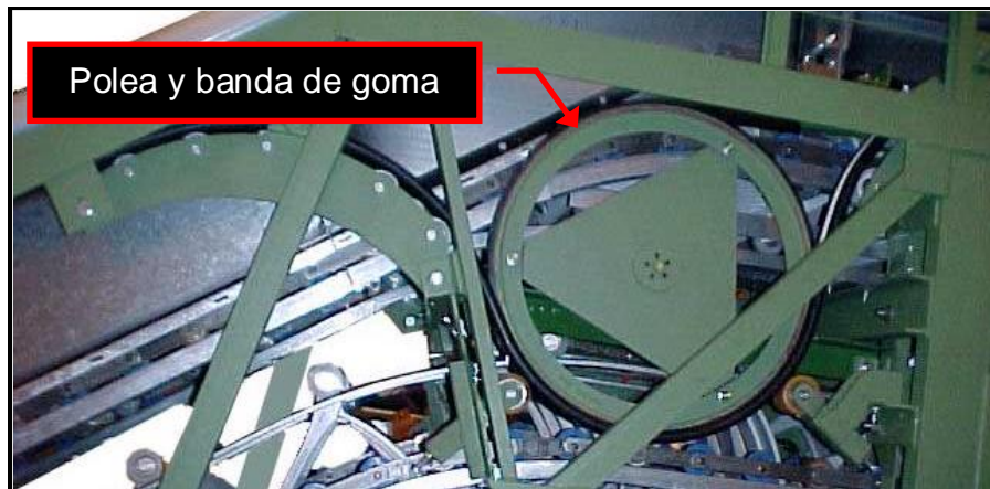
Figura 3. Conjunto sistema tracción pasamanos

El espesor de la banda de goma es de 30 mm sobre un diámetro aproximado de la polea de 668 mm.