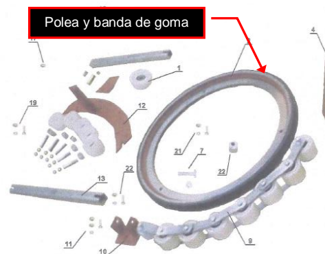
Figura 2. Componentes sistema de tracción