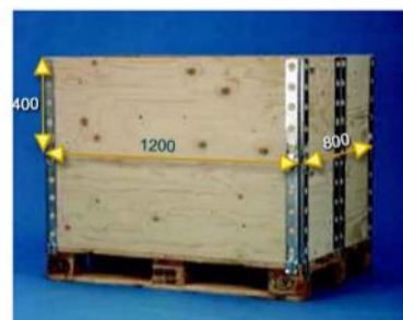
8. Contenedor montado.