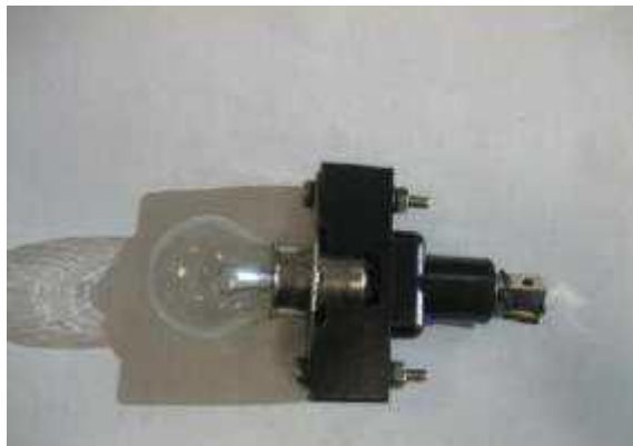
Ilustración 2 Portalámparas

El soporte de las lámparas incandescentes de las señales laterales de vía ha sido identificado como posible presencia de MCA. Por tanto, se tratará igual que el resto de elementos identificados con presencia de amianto.