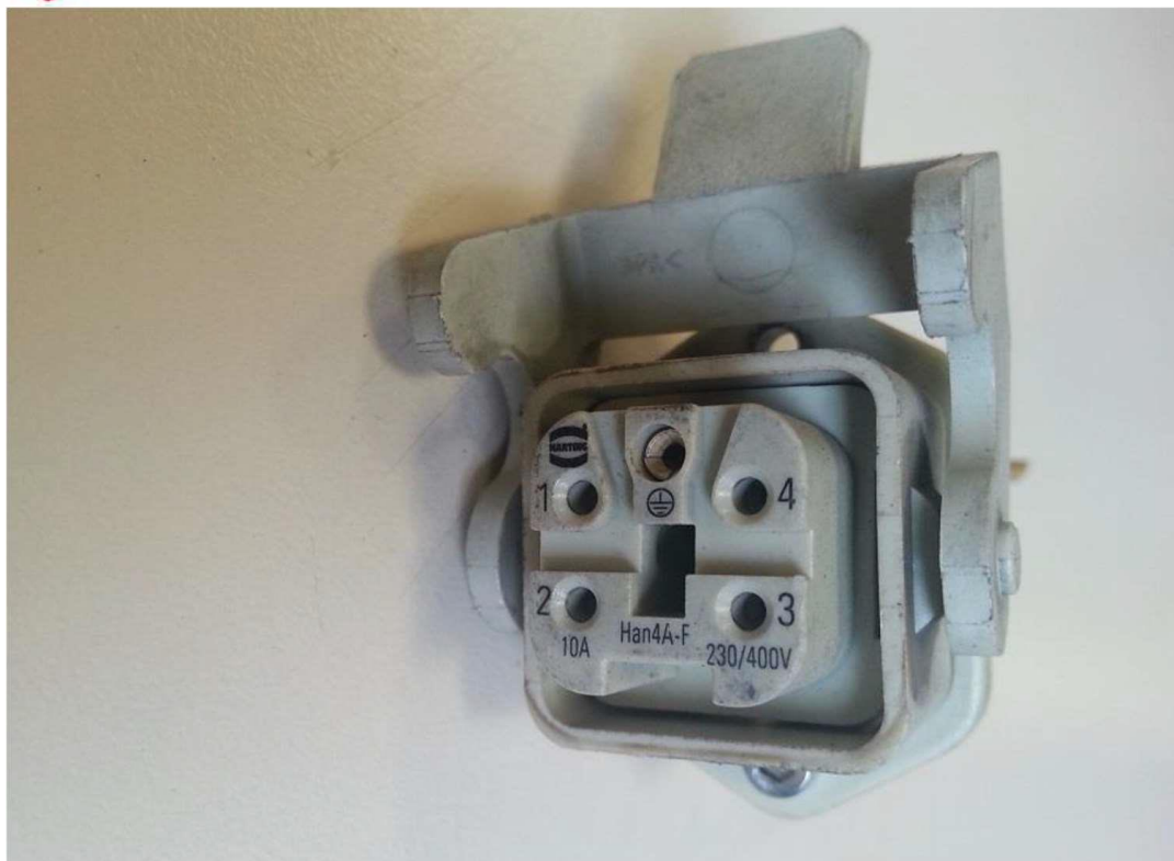
CONECTOR HARTING: 1º ROJO 2º NEGRO 3º NEGRO 4º AMARILLO