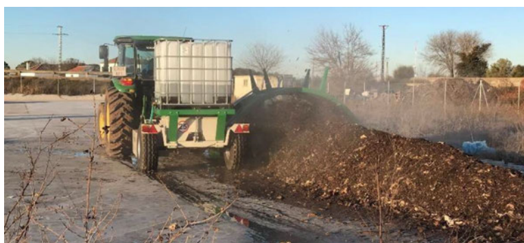
Figura 2. Fotografía de la volteadora sobre una pila de compost en la Planta Piloto Formativa de “El Encín”.

La Finca de “El Encín” (Alcalá de Henares) cuenta con una Planta Piloto Formativa de compostaje con una capacidad de 600 T-año -1 , que se puso en marcha en diciembre de 2021. Dicha planta está solada y dispone de un sistema de recogida de lixiviados que se acumulan en una cubeta. Además, se dispone de una volteadora para la mezcla adecuada de los biorresiduos y el estructurante y para favorecer la aireación de la pila durante el proceso de compostaje (Fig. 2).