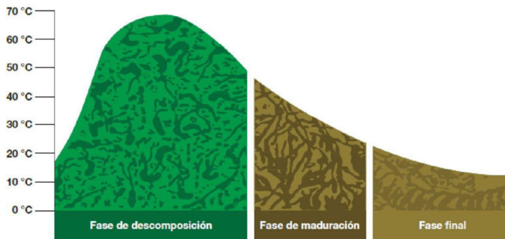
Figura 3. Fases del proceso de compostaje y temperaturas alcanzadas en cada etapa.

Además, de forma mensual se determinará el pH y la conductividad eléctrica de las distintas pilas para hacer un seguimiento más completo del proceso de compostaje.