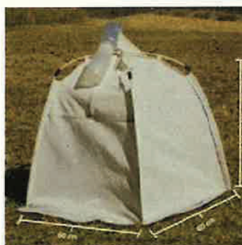
Figura 16. Ejemplo de trampas utilizadas para el muestreo de abejas que crían en el suelo.

Se elaborará como entregable un informe de las actuaciones realizadas en esta tarea durante el segundo semestre de 2022.