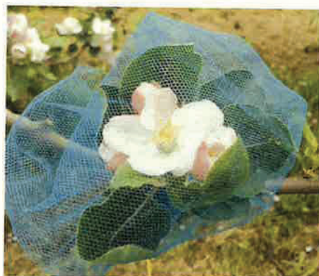
Figura 17. Ejemplo de bolsa de exclusión para polinizadores.