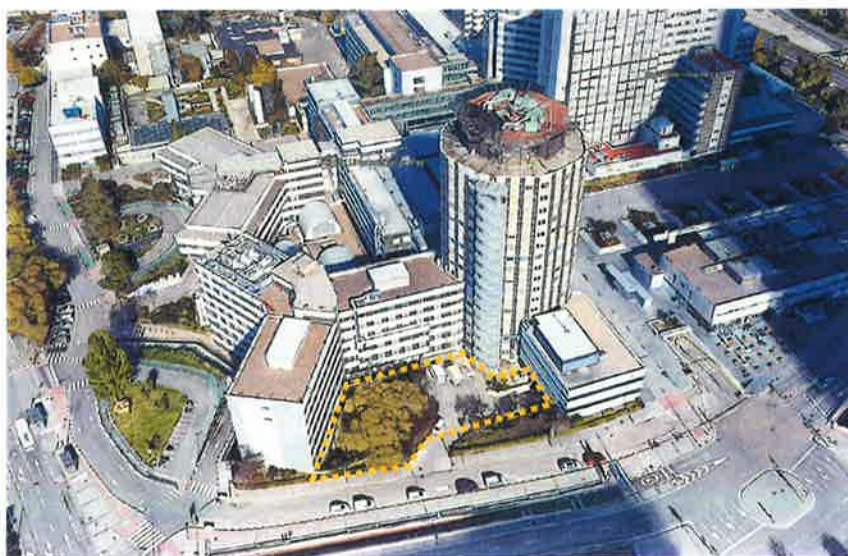
Identificación de la zona objeto del proyecto sobre imagen de satélite.

El área objeto de esta actuación se encuentra en el solar urbano del Hospital Universitario La Paz (HULP) ubicado en el Paseo de la Castellana n. 261, 28046, en Madrid. La parcela está limitada: al Norte por la carreta de Colmenar, a Oeste con el Paseo de La Castellana, a Este con la Calle Pedro Rico y a Sur con la Calle Arzobispo Morcillo.