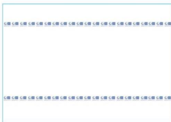
Imagen de la colcha de cama:

Procedimiento Abierto Simplificado Abreviado. Criterio Único.