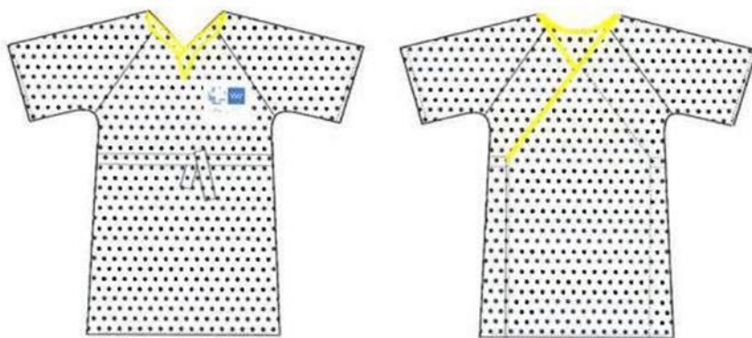
Imagen del camión abierto paciente adulto:

Deberá incorporar de manera oculta (cosido en dobladillo de la parte inferior trasera) el dispositivo de identificación por radiofrecuencia UHF.