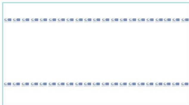
Imagen de la toalla de lavabo y toalla de ducha: