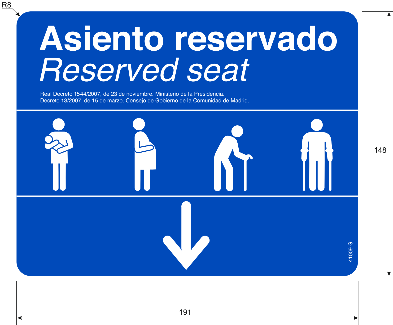
Cara vista por el interior del coche (adhesiva)