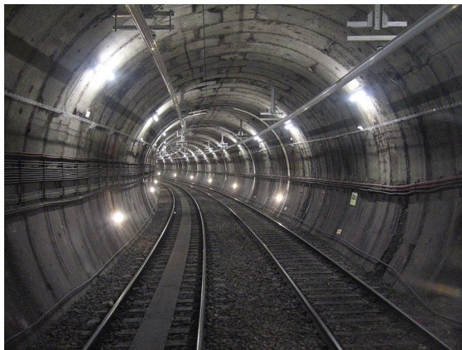
Figura 5: imagen de túnel electrificado con catenaria rígida.

La catenaria rígida está constituida por un perfil de aluminio extrusionado en el que se inserta el hilo de contacto. Este carril se suspende de unos aisladores que se fijan a la bóveda del túnel o a la correspondiente estructura portante sobre estructuras metálicas que permitan la regulación en altura y en peralte.