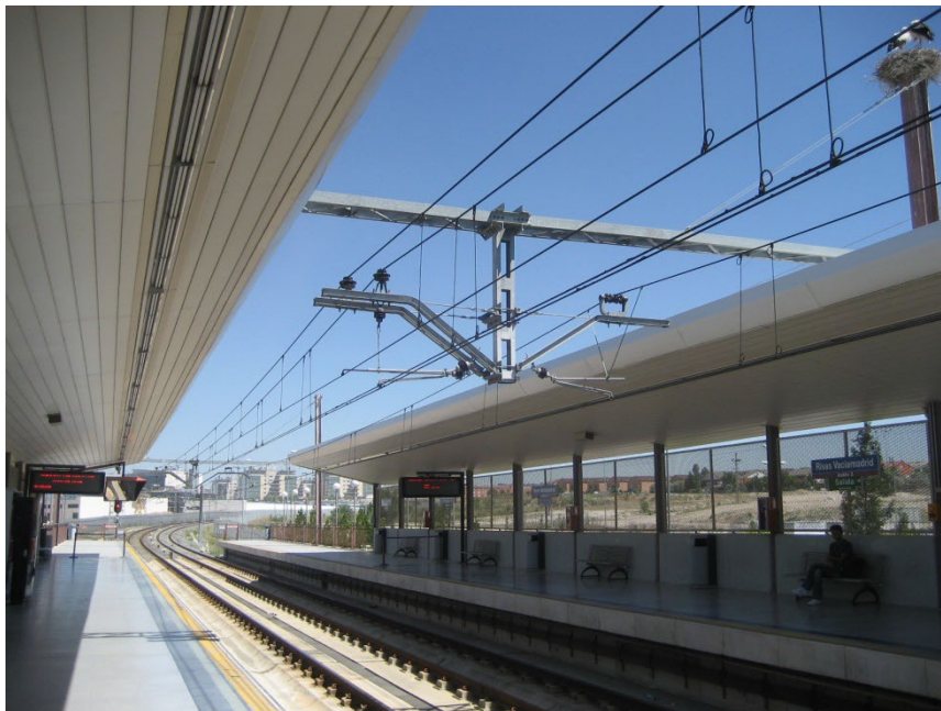
Figura 4: Estación de Línea 9 con catenaria convencional