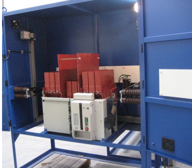
Figura 2: armario seccionador

Actualmente existen en las líneas de Metro de Madrid dos modelos de interruptores seccionadores, uno de fabricante Ferraz y otro General Electric. Las especificaciones mínimas de ambos son las siguientes: