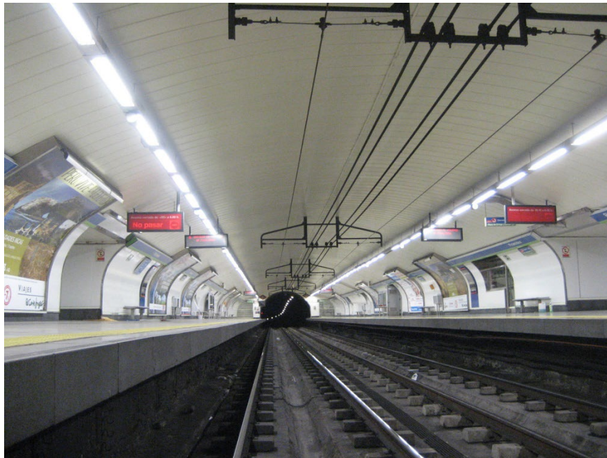
Figura 3: imagen de una estación con hilo tranviario.