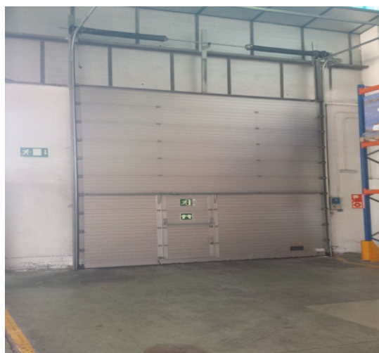
Modelo 542 Con Puerta Peatonal