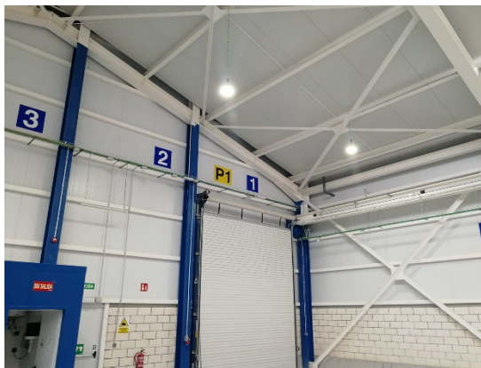
PUERTA NAVE BOGIES

La prestación del servicio consistirá en realizar los mantenimientos preventivos recomendados por el fabricante y los correctivos que surjan durante la duración del contrato (5 años) de los equipos anteriormente listados.