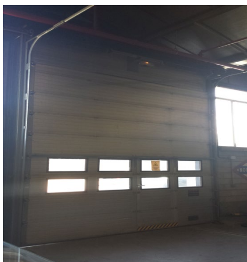
Modelo 342 manual con Puerta Peatonal