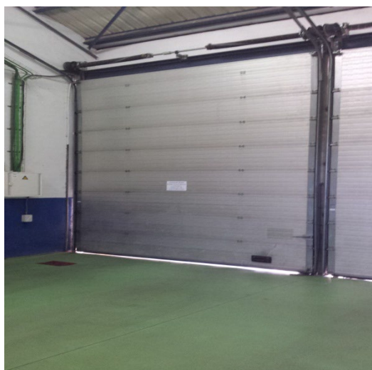
Modelo 342 eléctrica sin Puerta Peatonal