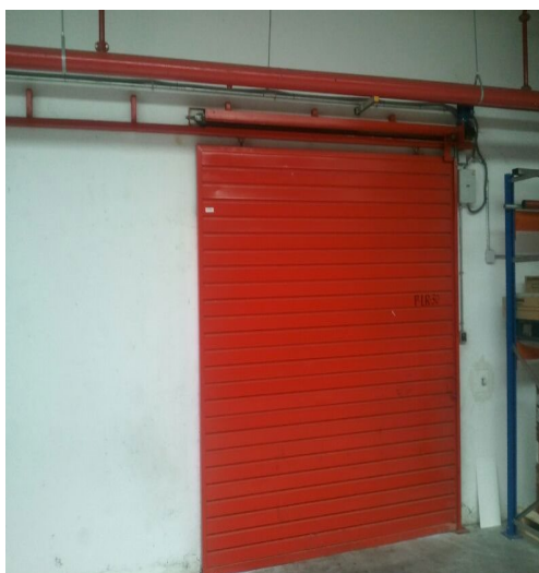
PUERTA LORANCA Y CUATRO VIENTOS