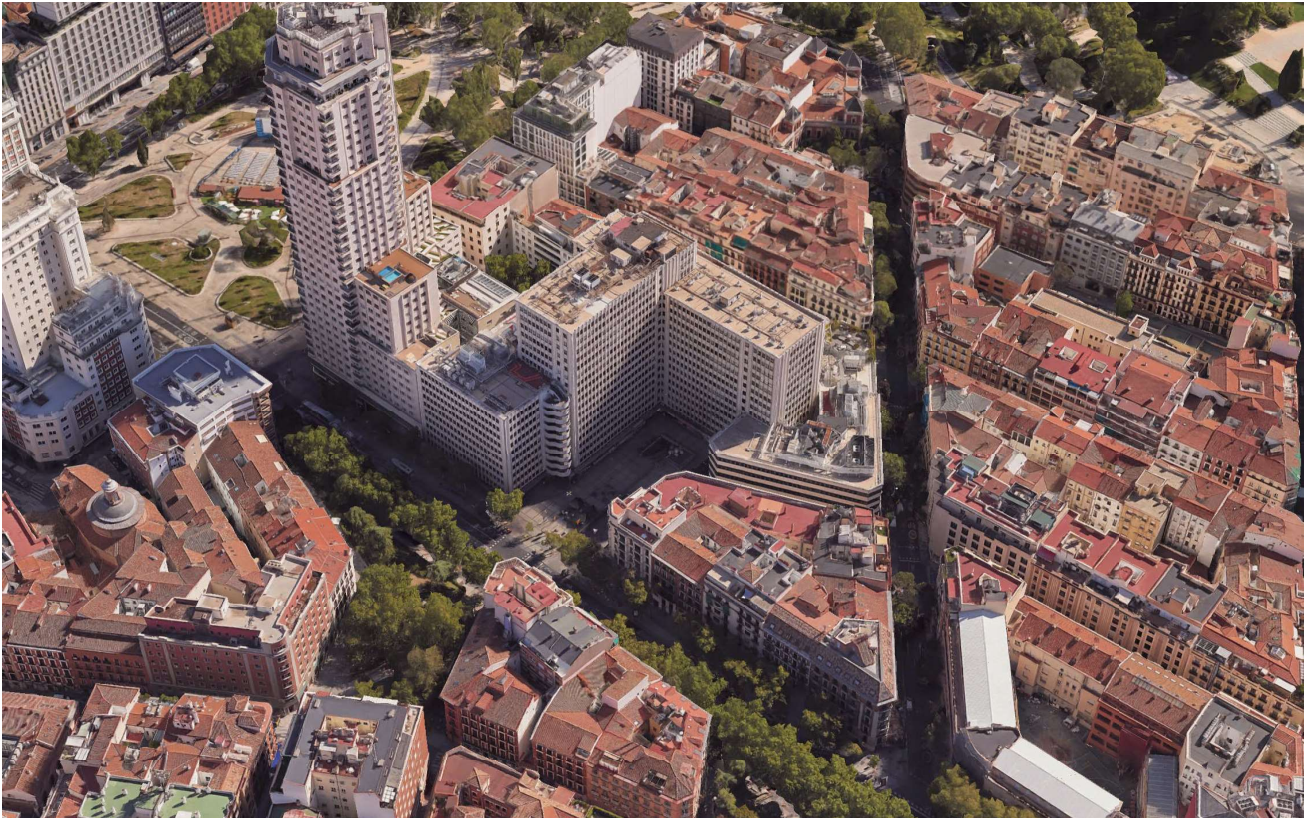
FOTOGRAFÍA AÉREA DE LA SITUACIÓN DEL INMUEBLE

El edificio se sitúa en la Calle Princesa nº 5, Distrito de Moncloa-Aravaca, en el Municipio de Madrid.