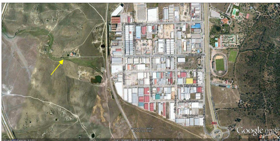
Imagen 5: Situación EDAR Capellanías, cercano al polígono industrial Capellanías

Está ubicada en el Polígono Industrial Las Capellanías, calle C-35 (Cáceres). Las coordenadas UTM son: X: 721244; Y: 4373694.