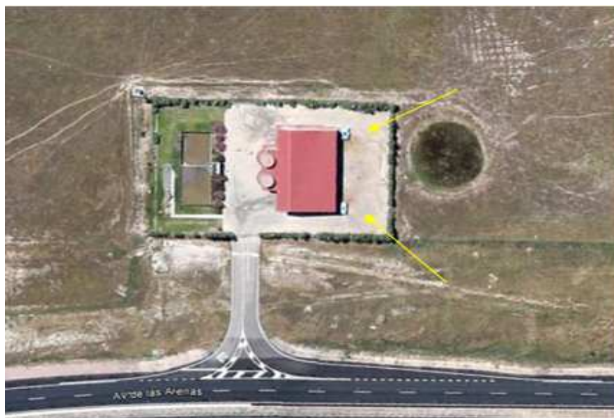
Imagen 4: Situación de los puntos de almacenamiento de fangos

Existen dos puntos de almacenamiento de fangos, ubicados en la parte posterior de la instalación, siendo ambos de fácil accesibilidad. Los puntos están constituidos por contenedores superficiales metálicos de 7 m 3 de capacidad de almacenamiento y de altura máxima de 1,20 m.