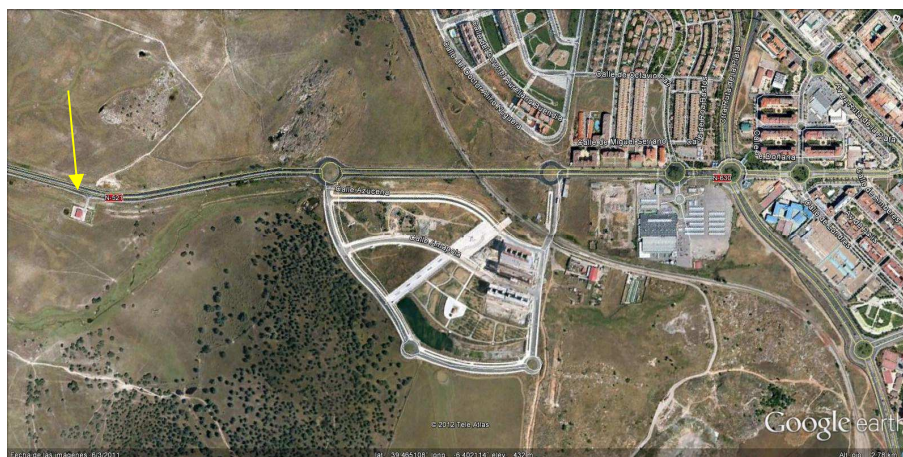
Imagen 3: Situación EDAR Malpartida N-521 antes de la A-66

Está ubicada en CTRA. N-521 TRUJILLO-VALENCIA DE ALCÁNTARA, KM. 51,5. Las coordenadas UTM son: X: 722417; Y: 4371246.