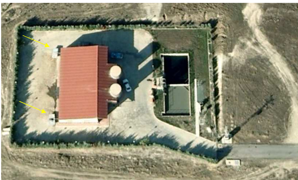
Imagen 6: Situación de los puntos de almacenamiento de fangos

Existen dos puntos de almacenamiento de fangos, ubicados en la parte posterior de la instalación, siendo ambos de fácil accesibilidad. Los puntos están constituidos por contenedores superficiales metálicos de 7 m 3 de capacidad de almacenamiento y de altura máxima de 1,20 m.