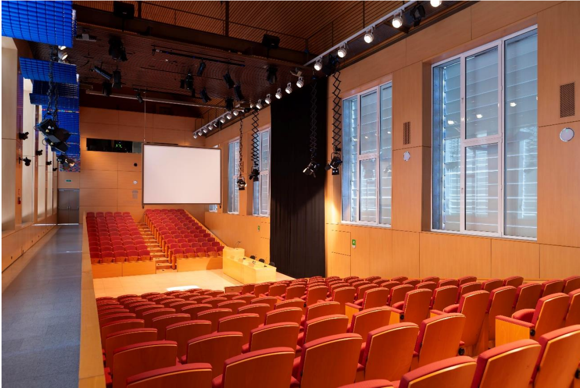
Ejemplo auditorio en aforo completo 1