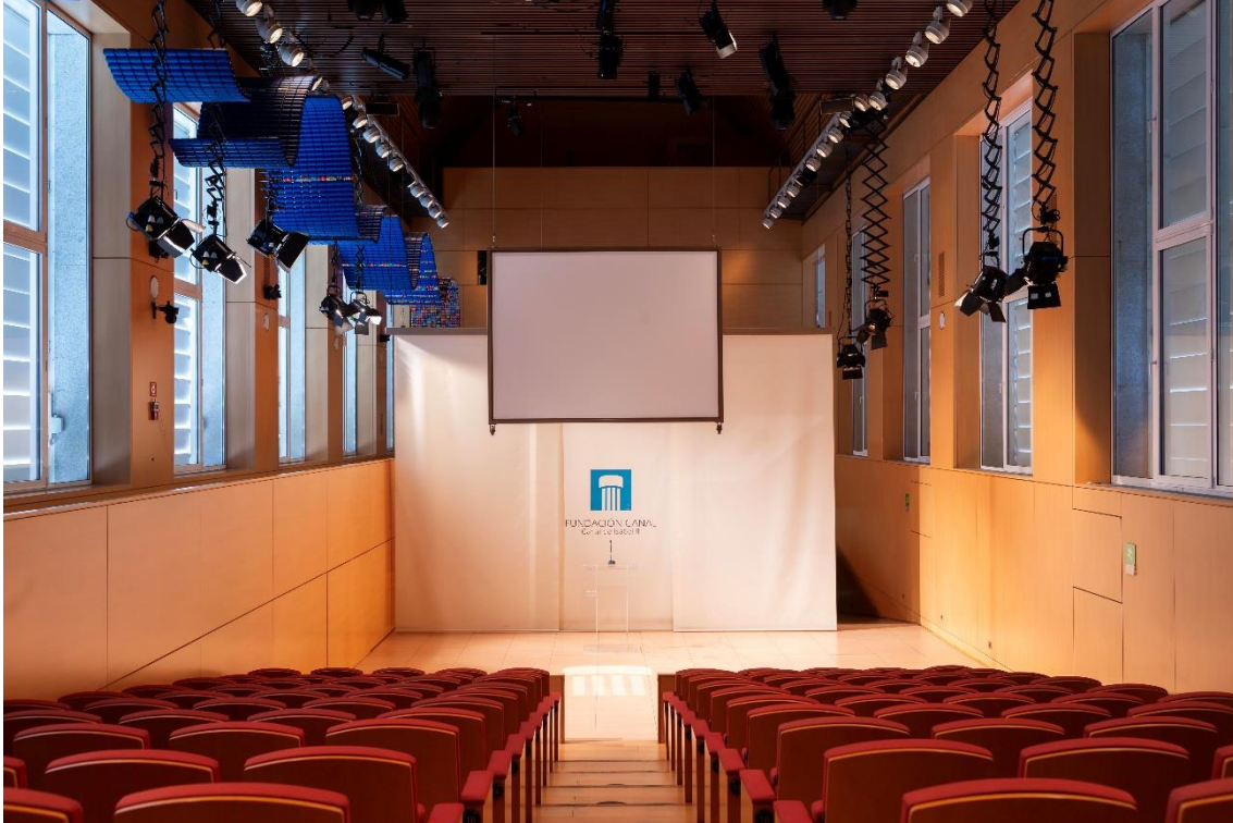
Ejemplo auditorio en medio aforo 1