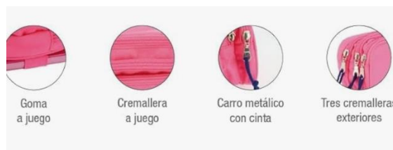
Goma a juego