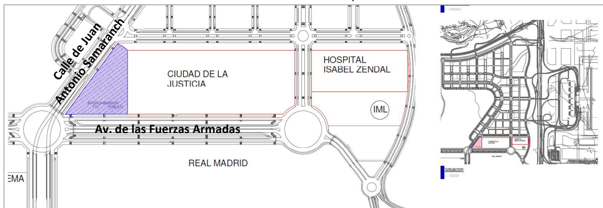
Plano de ubicación de la parcela

El contrato tendrá por objeto la realización de los trabajos de limpieza referente a la zona de aseos y los suelos de la zona pública del nuevo Intercambiador de Transportes de Valdebebas, ubicado en la confluencia de la Av. de las Fuerzas Armadas y la Calle de Juan Antonio Samaranch, junto a la futura Ciudad de la Justicia.