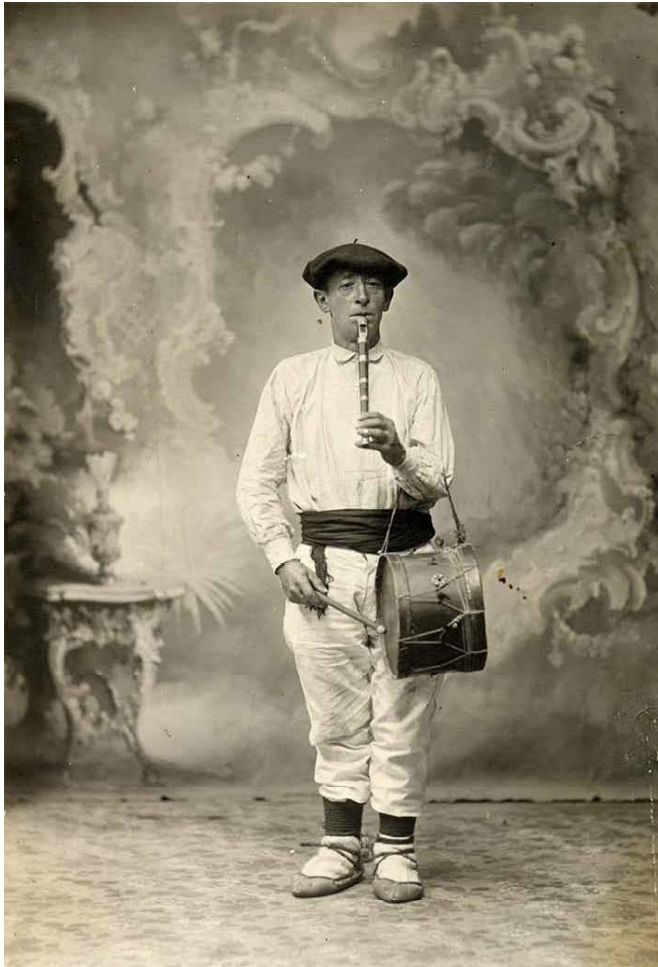
ANÓNIMO. Músico en el estudio del fotógrafo. Navarra (?), hacia 1915 (Museo del Traje)