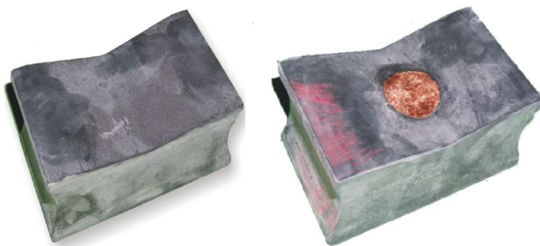
73430. Taco rueda elástica sin toma de tierra

Es de señalar que uno de los potenciales problemas de estas ruedas se origina por los retornos de corriente de tracción; en este caso, este retorno se realiza intercalando unos tacos de goma con una conexión eléctrica de cobre que une el bandaje con el cubo o centro de rueda y garantiza la continuidad eléctrica. Este es el motivo por el que es necesaria la adquisición de dos tipos distintos de tacos elásticos. En la imagen siguiente se muestran ambos tipos, el de la derecha es el que incorpora la conexión eléctrica.